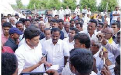
గుంటూరు (చైతన్యరథం): సీసీబి పత్తి కొనుగోళ్ళు కేంద్రాల్లో కొనుగోళ్ళు పూర్తిస్థాయిలో ప్రారంభం కాకపోవడంపై గ్రామీణ