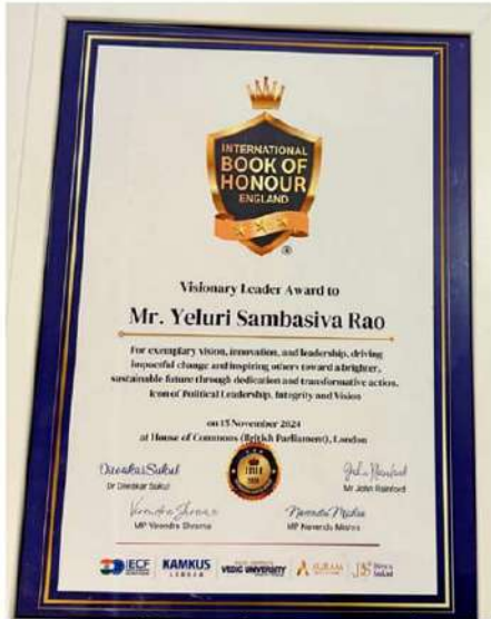
బంగారు బాటలు వేసేలా యువ మేధావులను నూతన ఆలోచనల వైపు ఆదుగులు వేసేలా ప్రోత్సహిస్తున్నారు. సమాజాభివృద్ధికి అంతర్యామి అంటే చరిత్రా ప్రజా సంక్షేమంలో పాటు నిస్తూనే ఉంటుంది.