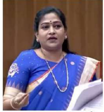
మహిళల భద్రతకు కూటమి ప్రభుత్వం పెట్టడం 2014-19 మధ్య ఏపీలో మహిళలపై అఘాయిత్యాలు, దాడులకు సంబంధించి 83,202 కేసులు నమోదయ్యాయి. 2019-24 మధ్య