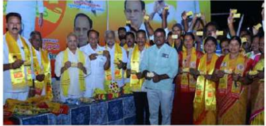
టీడీపీ సభ్యత్వ నమోదు..