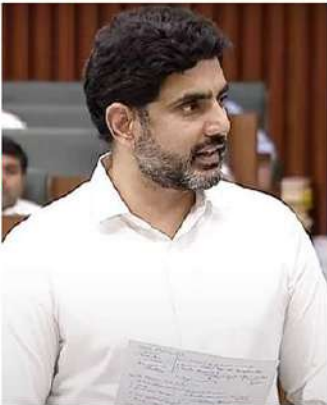
ఒక్క నిటింగ్లో అనాడు డీసీఎల్ తెచ్చాం

2014లో ఏపీ విభజన జరిగింది. ఇది మనం కోరుకున్నది కాదు, అందరం కలసికట్టుగా 62వట్ల హైదరాబాద్ ను అభివృద్ధి చేసుకున్నాక అనంతంగా విభజన చేశారు. రాష్ట్ర విభజన తర్వాత ఒకే రాష్ట్రం, అభివృద్ధి వికేంద్రీకరణ జరగాలని నాడు ముఖ్యమంత్రి చంద్రబాబునాయుడు భావించారు. అందులో భాగంగా ఉమ్మడి అనంతపురంను ఆరోముఖైల్ క్యాటరీగా, ఉమ్మడి కర్నూలు జిల్లాలను రెవెన్యూమంట్ ఎన్టీ క్యాటరీగా, చిత్తూరు, కడప జిల్లాలను ఎలక్షన్ క్యాటరీగా, నెల్లూరు జిల్లా రైవల్వైట్ ఇండస్ట్రీ క్యాటరీగా, ప్రకాశం పిపర్ మ్యూస్ ప్యాక్యూరింగ్, బయో ఫ్యూయర్ హబ్ గా, గుంటూరు, కృష్ణా జిల్లాల్లో రాజధాని ప్రాంతం, ఉభయగోదావరి జిల్లాలను పెట్రో కెమికల్స్, ఆక్సా హబ్ గా, ఉద్ధరంద్రంను ఫిర్యా మెడికల్ డివైజెస్, బిల్ హబ్ గా అభివృద్ధి చేయాలని నిర్ణయించి ప్రభావితం చేశారు. అందులో భాగంగా 2014-19 మధ్య అత్యుత్తమ బిల్ పాలసీ తెచ్చారు. తిరుపతి, కడప కేంద్రంగా పెద్దపత్తుల ఎలక్షన్ క్యాటరీ మ్యూస్ ప్యాక్యూరింగ్ పరిశ్రమలు రప్పించారు. బడేళ్లలో రూ. 16వేల కోట్ల పెట్టుబడులు, 93వేల మందికి ఉపాధి కల్పించేలా 53 కంపెనీలతో అనాడు ఒప్పందాలు చేసుకున్నారు. చంద్రబాబు కృషి ఫలితంగా దేశంలో 2గిగాతం సెల్ ఫోన్స్ ఏపీలోనే తయారయ్యే పరిస్థితి వచ్చింది. ఫ్యాక్ట్ వంటి ప్రఖ్యాత ఎలక్షన్ క్యాటరీ పరిశ్రమలు రాష్ట్రానికి వచ్చాయి. పరిశ్రమలకు అనేక ప్రోత్సాహకాలు ఇచ్చారు. అప్పట్లో నేను చైనా వెళ్లి డీసీఎల్ ప్రతినిధులతో ఒక్క డిస్కర్ మీటింగ్ ఒప్పందాన్ని కుదుర్చుకున్నాం. 20వేల మందికి ఉపాధి కల్పించే 300 మిలియన్ డాలర్ పెట్టుబడిని రాజధానిగా రాష్ట్రానికి