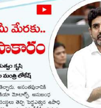
ఎంతానో అభివృద్ధి చేశారు. మామిడి, ఆరటి, బొప్పాయి, డ్రాగన్ ఫ్రూట్ వంటి పంటలను ప్రోత్సహించారు.