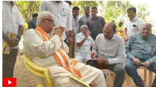
విజయనగరం పార్లమెంట్ సభ్యులు కలిపి అప్పలనాయుడికి విజ్ఞానం శీతాకాల సమావేశాల్లో చర్చించాల్సిన పలు అంశాలపై మాజీ కేంద్ర మంత్రి పూసపాటి లోక గజపతిరాజు బిశాఖలో చేని వెలు నలవలూ సూచనలు అందించారు.