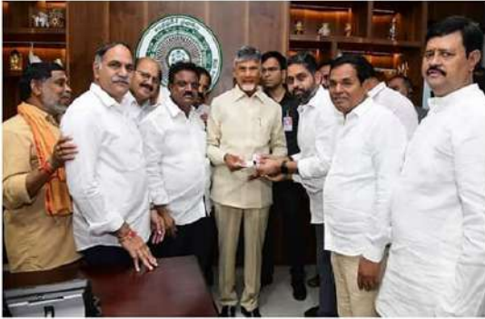
విజయవాడ వరద బాధితుల కోసం