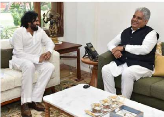
అయ్యారు. ఎర్రచందనం రకజ, స్పృంగ్ నిరోధం, దుంగల అమ్మకం విషయంలో అయి సంవత్సరాలు