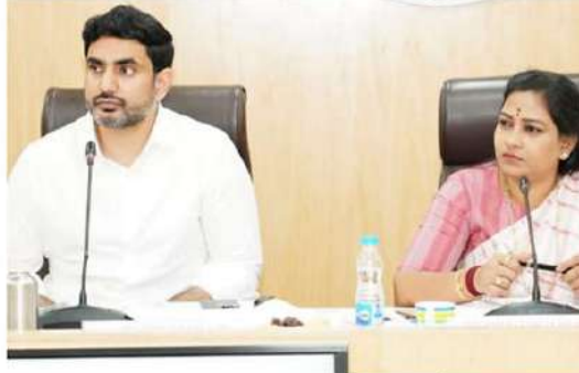
- వివరాలు 5లో..