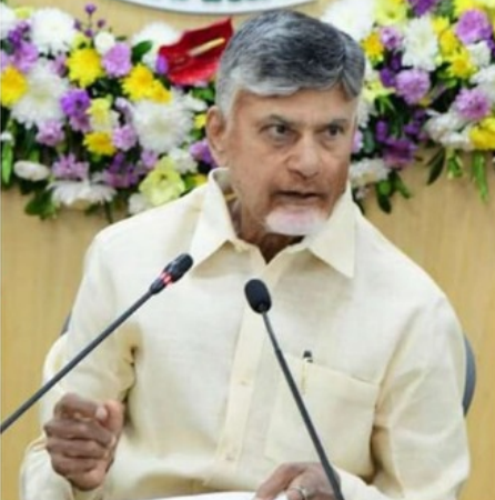
షిజకల్ వెరిఫికేషన్తో అనర్వులను తొలగించాలన్నారు. ముఖ్యంగా వికలాంగులకు జారీ చేసే సదరం నర్టిఫికేషన్ల జారీలో అక్రమాలను పూర్తిగా నివారించాలని సూచించారు. నర్టిఫికేషన్ల జారీ చేసే దాకం మెడికల్ బోర్డు మార్గదర్శకాలు సక్రమంగా

అమరావతి: రానున్న 3 నెలల్లో ప్రతి పంచాయతీ జిల్లా కలెక్టర్ల పరిశీలించాలని సీఎం చంద్రబాబు ఆదేశించారు. చాలామంది అనర్వులకు పంచాయతీ వెళ్లినా న్యాయంకాదు మంత్రి నాదెండ్ల మహేష్ కుమార్ చేసిన వ్యాఖ్యలకు చంద్రబాబు తగ్గవద్దానని స్పందించారు. పంచాయతీ రాజ్ మరియు గ్రామీణాభివృద్ధిపై రెండో రోజు కలెక్టర్ల సమావేశంలో ముఖ్యమంత్రి నారా చంద్రబాబునాయుడు మాట్లాడుతూ... రాష్ట్రంలో వివిధ సామాజిక ఫింబిల్స్ అర్జులకు అందేలా చూస్తూనే.. అనర్వులను తొలగించేలా కట్టుదిట్టమైన చర్యలు తీసుకోవాలని స్పష్టం చేశారు. ఇందుకు సాంకేతిక, హైటెక్ విధానాలను వినియోగించి