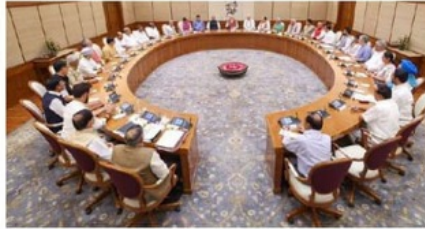
ఒకే దేశం.. ఒకే ఎన్నికలు..

ఇక ఈ బిల్లును సభలో ప్రవేశపెట్టిన తర్వాత విస్తృత సంప్రదింపుల కోసం జాయింట్ పార్లమెంటరీ కమిటీకి (జేపీసీ) అవకాశం ఉన్నట్లు సంబంధిత వర్గాలు తెలిపాయి. ఈ బిల్లుపై చర్చించేందుకు అన్ని రాష్ట్రాల అసెంబ్లీల స్పీకర్లలనూ ఆహ్వానించమన్నట్లు సమాచారం. కాగా, జమిలి ఎన్నికల నిర్వహణ సాధ్యసాధ్యాలపై కేంద్ర ప్రభుత్వం నియమించిన రామనాథ్ కోవింద్ కమిటీ ఇప్పటికే నివేదిక సమర్పించిన సంగతి తెలిసిందే.