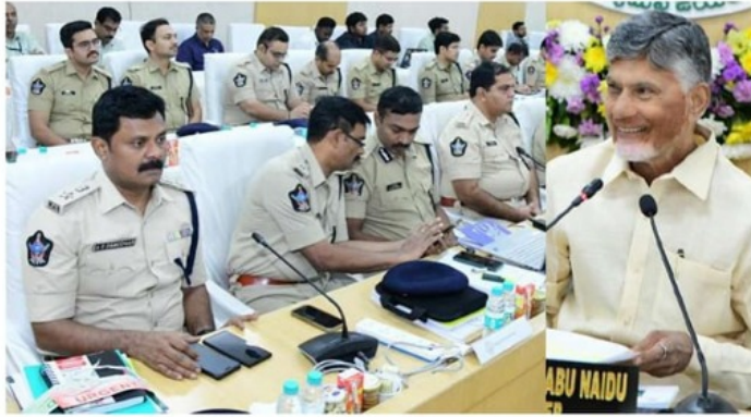
శ్రీయాశీలకం కావాలన్నారు. నేరస్థుల వివరాలను ఆన్లైన్లో ఉంచాలని, రాష్ట్రంలో వివిధ యాక్టివిటీ హాట్ స్పాట్లపై ప్రత్యేక దృష్టి పెట్టి జాగ్రత్తలు తీసుకోవాలని చంద్రబాబు సూచించారు.

అమరావతి (చైతన్య రథం): గత ప్రభుత్వ పాలనలో ప్రజాసమ్మతానికి దూరమైన పోలీస్ శాఖ.. ప్రెండ్స్ పోలీసింగ్ తో ప్రజా సమ్మతాన్ని చూడగోసాలని ముఖ్యమంత్రి చంద్రబాబు పిలుపునిచ్చారు. మహిళలు, దీనినారుల రక్షణకు పోలీసింగ్ ఫెన్సింగ్ కావాలన్నారు. యువత డ్రగ్స్, గంజాయిలంది మాట్లాడని పదకుండా నిఘా పెంచాలన్నారు. సైబర్ సేఫ్టీ, మిస్సింగ్ కేసులు, రహదారి భద్రత, ఆస్తుల పరిరక్షణపటి అంశాలపై రాష్ట్ర పోలీసులు ప్రధానంగా దృష్టి పెట్టాలని ముఖ్యమంత్రి చంద్రబాబు మాట్లాడారు. గడిచిన ఆరు నెలల్లో రాష్ట్రంలో నేరాలు తగ్గి, పోలీసింగ్ పై ప్రజల్లో నమ్మకం పెరిగిందన్నారు. సీసీ డీవీలు, డ్రాఫ్టు, ఎవిడెన్స్, ఎటాచింగ్ అత్యాచార సాంకేతికత వినియోగించుకుని స్వాగ్ట్ పోలీసింగ్ అలవర్చుకోవాలన్నారు. రాష్ట్రంలో రానున్న మూడు మాసాల్లో శాంతి భద్రతలు పూర్తిగా అదుపులోకి రావాలని, నేరాల నియంత్రణలో సాంకేతికతను పూర్తిగా వినియోగించాలన్నారు. పబ్లిక్ స్థలాలు, ప్రార్థనా మందిరాలు, షాపింగ్ మాల్స్ తదితరచోట్ల సీసీ డీవీ కెమెరాలు ఏర్పాటు చేసి రియల్ టైం మానిటరింగ్ చేయాలన్నారు. సీసీ కెమెరాలు కనరేట్ తేలికాగా డ్రాఫ్ట్ ద్వారా పర్మిట్ చేయాలని, పోలీసులు చురుగ్గా పనిచేస్తే నేరస్థులు ఇన్వెస్ట్ అవుతారని, పోలీసులు ఇన్వెస్ట్ చేత నేరస్థులు యాక్టివ్ అవుతారని, ఈ విషయాన్ని పోలీసులు గుర్తు పెట్టకుండా చూడకూడదని సూచించారు. గతంలో నేరస్థులను నేరస్థులుగానే చూశాం... కానీ నేడు నేరస్థులు రాజకీయ ముసుగులో పని చేస్తున్నారని హెచ్చరిస్తూ.. నేరాల నియంత్రణలో సైబర్ సెక్యూరిటీ విభాగం