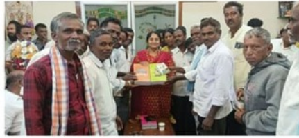
పెనుకొండ క్యాంపు కార్యాలయంలో రాష్ట్ర జీసీ సంక్షేమ చేనేత జోకా శాఖ మంత్రి సచివకు కలసిన సూతనంగా ఎన్నికైన సోగునీటి సంఘం అధ్యక్షులు, ఉపాధ్యక్షులు, పలువురు కూటమి నాయకులు