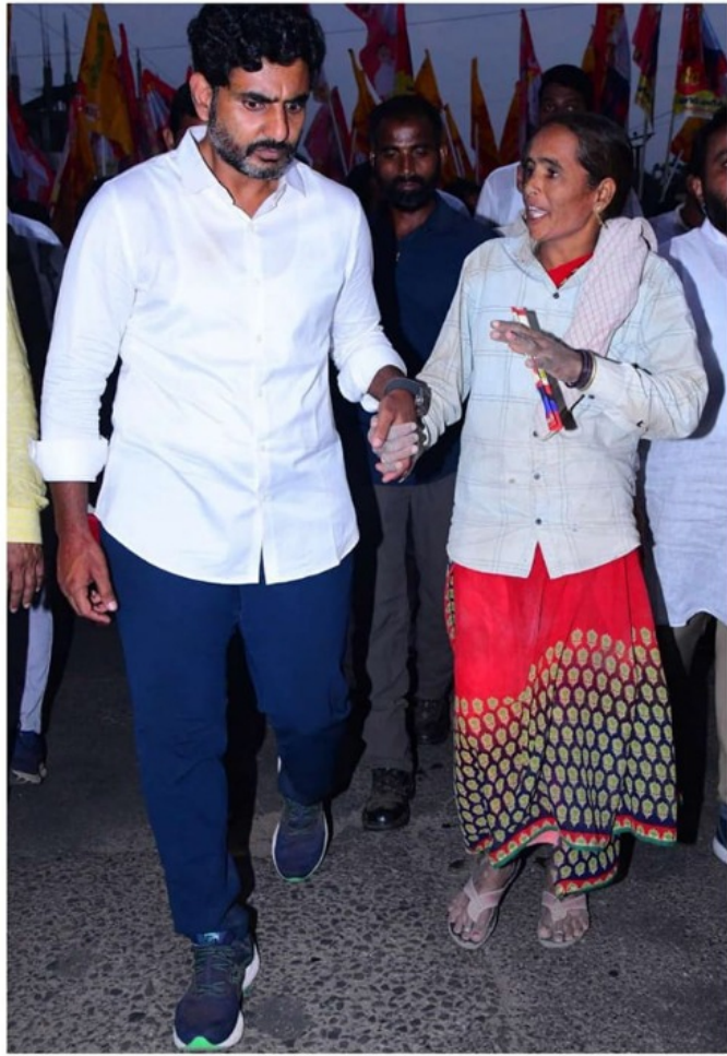
ప్రభుత్వం ఎంతలా అందోళన చెందిందో అర్థంచేసుకోవచ్చు.