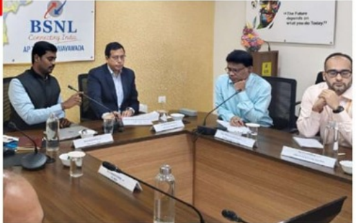
విషయాన్ని ప్రభుత్వం ముందుంచారు. గుజరాత్ గాంధీనగర్ జిల్లాలోని గుజరాత్ ఇంటర్నేషనల్ పీఎన్-జెటి సీటీ (గిట్ల) నగరంలో గ్యాస్ మొదలు విద్యుత్తు, టెలికాం కేబుల్ వరకు అన్ని కూడా అండర్ గ్రౌండ్లో ఉంటాయని, అక్కడ అవాసాలకు, వ్యాపార