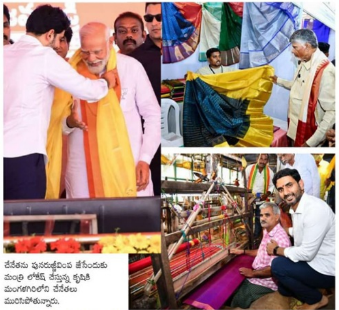
చేనేతను పునరుద్ధరించే కోసం మంత్రి లోకేశ్ చేస్తున్న కృషికి మంగళగిరిలోని చేనేతలు మునిసిపాలిటీలు.