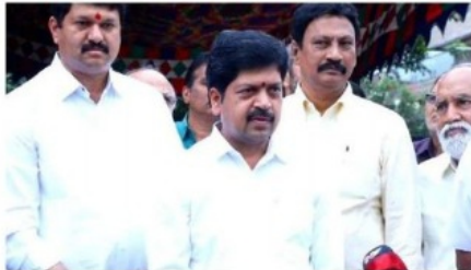
బుడమేరు కాలువ గట్టపై నుండి మట్టి తవ్వకుని అమ్ముకున్నారని ధ్వజమెత్తారు. అంత పెద్ద స్థాయిలో వరదలు ముంచెత్తినా.. సీఎం చంద్రబాబు తన పాలనా దక్షతతో పది రోజుల్లో నగరం మొత్తాన్ని యథా స్థితికి తీసుకొచ్చారు. ఎప్పుడూ ఎక్కడా ఏ ఒక్కరూ ఇవ్వని విధంగా బాధిత కుటుంబాలకు ప్యాకేజీ ఇచ్చారన్నారు. గత పాలకులు 15వ ఆర్థిక సంఘం నిధులు కూడా దారి మళ్లించారు. రోడ్డు, డ్రైనేజీలు గాలికి వదిలేశారు.