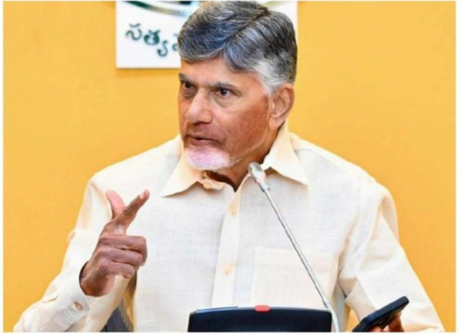
హోమ్ లో పనిచేస్తున్నారు. వారి అవసరాలు ఏంటనే సమాచారం సేకరించాలని అధికారులకు సీఎం సూచించారు. అదేవిధంగా ఇప్పటికే నిర్ణయించినట్లు రతన్ టాటా ఇన్స్టిట్యూట్ హాల్ లో ఏర్పాటుకు

మిగిలిపోకూడదు. వారికి అవకాశాలు కల్పించాలని సీఎం అభిప్రాయపడ్డారు. వర్క్ ఫ్రం హోమ్, కో-వర్కింగ్ స్పెంటలతో మహిళలకు విస్తృతంగా అవకాశాలు లభిస్తాయన్నారు. మహిళలను ఇందికీ, ఇందిపనికి పరిమితం చేయడం సరికాదని సీఎం అన్నారు. ఇప్పటికీ చదువుకున్న మహిళలు ఇళ్లలో ఉంటున్నారని... వారికి వర్క్ ఫ్రం హోమ్ అందుబాటులోకి తెస్తే ఆన్లైన్ విధానంలో పనిచేసి ఉపాధి పొందుతారని అభిప్రాయపడ్డారు. మహిళల్లో ఎంతో సమర్థత, నైపుణ్యం ఉందని, కుటుంబ వ్యవహారాలు, బాధ్యత కారణంగా చాలామంది ఇళ్లకి పరిమితం అవుతున్నారన్నారు. ఇలాంటి వారికి అవకాశాలు కల్పిస్తే... ఎకనమిక్ యాక్టివిటీ పెరుగుతుందని ముఖ్యమంత్రి అన్నారు. కో-వర్కింగ్ స్పేస్ సెంటర్ల ఏర్పాటులో 2025 డిసెంబర్ చివరినాటికి 1.5 లక్షల సీట్లు అందుబాటులోకి తీసుకురావాలని లక్ష్యంగా పెట్టుకున్నట్లు అధికారులు వివరించారు. ఒక్కో సీటుకు 50-60 చదరపు అడుగుల విస్తీర్ణం అవసరమని.. ప్రభుత్వ ప్రైవేటు భవనాల్లో ఈ వర్కింగ్ సెంటర్లు ఏర్పాటు చేస్తామని అధికారులు తెలిపారు. ఇప్పటివరకు ప్రైవేటు, ప్రభుత్వ భవనాల్లో 22 లక్షల చదరపు అడుగుల స్థలాన్ని గుర్తించామని అధికారులు ముఖ్యమంత్రికి తెలిపారు. రాష్ట్రంలో ప్రస్తుతం ఎంతమంది వర్క్ ఫ్రం