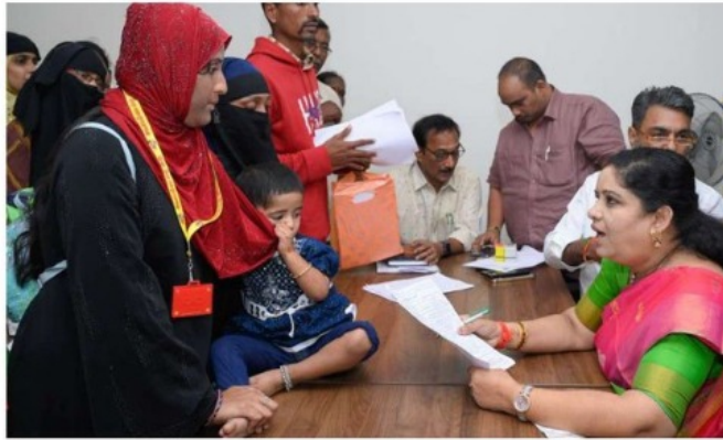
చేశారు. పంట వేసుకుంటే అర్థరాత్రిలో వచ్చి ధ్వంసం చేస్తున్నారు.. వారిపై చర్యలు తీసుకోవాలని అధికారులను వేడుకుంటే సైసీ నేతల వద్ద లంచం