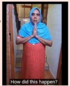
How did this happen?