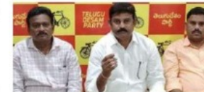
జగన్ రెడ్డి తొమ్మిది సార్లు విద్యుత్ ఛార్జీలు పెంచారని గుర్తుచేశారు. జగన్ రెడ్డి హయాంలో గుజరాత్లో రూ.1.99 లక్షల యూనిట్ ఉండే అధిక రేటుకి రూ.2.59 లక్షలకు, ట్రాన్స్ మిషన్ ఛార్జీతో కలిపి రూ.4.50 లక్షలకు అక్కో యూనిట్ ప్రజల నెట్టి భారం మోపారని మండిపడ్డారు. జగన్ రెడ్డి కమిషన్ కు కక్కుర్తిపడి రూ.1750కోట్లు లంచం తీసుకు స్వల్ప ఆమోకాల్ ఎఫ్ బివీ సన్స్ కేసు పెట్టిన సంగతి రాష్ట్ర ప్రజలందరూ చూశారన్నారు. 2014 చంద్రబాబు ప్రభుత్వంలో డిసెంబర్ కాంట్రాక్టు