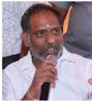
కారణంగా విదేశీ బ్యాంకర్లు పెట్టుబడిదారులు కేంద్రానికి పుచ్చారు చేశారని, ఈ కారణంగా విద్యుత్ వినియోగించుకోకపోయినా దబ్బు చెల్లించాల్సి వచ్చినది మంత్రి గొట్టిపాటి తెలిపారు.

ఉన్నప్పుడు గుట్టువప్పుడు కాకుండా విద్యుత్ రెగ్యులేటరీ కమిషన్ (ఈఆర్సీ)కు ప్రతిపాదనలు పంపారన్నారు. సాధా రణంగా ఈఆర్సీకి పంపిన 90 రోజుల్లోపు ట్రా ఆఫ్ ఛార్జీలు ఆమోదం పొందాలని... కానీ ఎన్నికల ఫలితాలు వచ్చేవరకు కూడా ట్రా ఆఫ్ ఛార్జీలను వాయి దా వేస్తూ వచ్చారన్నారు. కూటమి ప్రభుత్వం ఆధికారంలోకి వచ్చిన తరువాత ఈఆర్సీ నుంచి ఆమోదం పొందిన ట్రా ఆఫ్ ఛార్జీలు నేడు ప్రజలపై భారంగా పడుతున్నాయని మంత్రి గొట్టిపాటి వివరించారు.