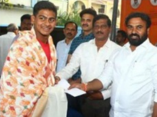
ప్రోత్సాహకాలను భారీగా పెంచామన్నారు. ప్రభుత్వ ఉద్యోగాల్లో సోసైటీ కోటా రిజర్వేషన్ ను 2 శాతం నుంచి 3 శాతం పెంచిన ఘనత మన రాష్ట్రానికే దక్కకుండా ఉండాలన్నారు. క్రీడాకారులకు మెరుగైన క్రీడా వసతులు, సౌకర్యాలు కల్పించే విషయంలో ప్రభుత్వం ప్రత్యేక శ్రద్ధ వహిస్తుందన్నారు. దానికి అనుగుణంగా క్రీడాకారులకు కూడా జాతీయ, అంతర్జాతీయ స్థాయిలో రాజీంది ప్రపంచవ్యాప్తంగా దేశ కీర్తిప్రతిష్టలను ఇవ్వమందింపజేయాలని ఆకాంక్షించారు.

నుంచి 450 మందికిపైగా స్పిర్మింగ్ పాల్గొనడం సంతోషదాయకమన్నారు. ఆక్వాటిక్స్ క్రీడలో ఏపీ నుంచి క్రీడాకారులు మరింత ఉన్నతంగా రాజీంది రాష్ట్ర కీర్తిప్రతిష్టలను విస్తృతం చేయాలన్నారు. ఆ దిశగా రాష్ట్రప్రభుత్వం క్రీడాకారులకు కావాల్సిన ఘాట్రి సహకారాన్ని అందిస్తుందన్నారు. సీఎం చంద్రబాబు నాయుడు ఆదేశాలు, ఆశయాలకు అనుగుణంగా దేశంలోనే అత్యుత్తమంగా ఏపీ సోసైటీ పాలసీని తీసుకొచ్చామన్నారు. అలాగే క్రీడాకారుల