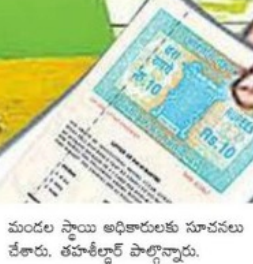
మండల స్థాయి అధికారులకు సూచనలు చేశారు. తహశీల్దార్ పాల్గొన్నారు.

మినహాయింపు లభిస్తుందన్నారు. జామీ మండలం కుమారాలో తు క్రవారం నిర్వహించిన రెవెన్యూ సదస్సులో జాయింట్ కలెక్టర్ పాల్గొన్నారు. ఈ సందర్భంగా గ్రామ ప్రజల భూసమస్యలు తెలుసుకున్నారు. వాటిని ఎలా పరిష్కరించాలనే అంశంపై