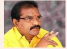
జగన్ ఇంటిముందు ధర్మాలు చేయాల్సి