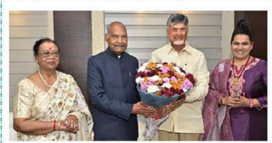
అమరావతిలోని అమర్-శర్మదీ దర్శనానికి హాజరైన మాజీ రాష్ట్రపతి రామ్ నాథ్ కోవింద్ దంపతులు రాజ్ భవన్ లోని గవర్నర్ అబ్దుల్ నజీర్ ఆతిథ్యం తీసుకున్నారు. మాజీ రాష్ట్రపతి రామ్ నాథ్ దంపతులను శుక్రవారం రాజ్ భవన్ లో ముఖ్యమంత్రి చంద్రబాబు నాయుడు దంపతులు.