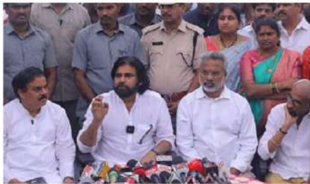
స్వదించాలన్నారు. అధికారులపై ఆగ్రహం

కాకినాడ యాంకరేజ్ పోర్టు నుంచి రేషన్ బియ్యం భారీస్థాయిలో అక్రమ రవాణా జరుగుతుంటే ఏం చేస్తున్నారని అధికారులపై డిప్యూటీ సీఎం పవన్ కల్యాణ్ ఆగ్రహం వ్యక్తం చేశారు. ప్రజాప్రతినిధులు, నాయకులు వచ్చి అక్రమ రవాణా ఆపితే తానీ.. చర్యలు చేపట్టాలని నిలబడితారు. బియ్యం అక్రమ రవాణా వ్యవహారం నేపథ్యంలో కాకినాడ పోర్టులో ఆయన తుక్కువారం తనిఖీలు చేపట్టారు. పౌరసరఫరాల మంత్రి నాచెండ్ల మనోహర్తో కలిసి టోటలో సముద్ర లోపలికి వెళ్లి పరిశీలించారు. రెండు రోజుల క్రితం కాకినాడ జిల్లా కలెక్టర్ ఫోన్ మోహన్ అధ్యక్షంలో సముద్రం లోపల సుమారు 9 నాటికల్ డ్రైక్ల దూరంలో రవాణాకు సిద్ధమై పట్టణం నాకలోని 640 బస్సుల బియ్యాన్ని పవన్ స్వయంగా వెళ్లి చూశారు. పశ్చిమ ఆఫ్రికా దేశాలకు తరలించేందుకు సిద్ధంగా ఉన్న బియ్యాన్ని పరిశీలించారు. కాకినాడ పోర్టు నుంచి ఈ స్థాయిలో బియ్యం అక్రమంగా రవాణా అవుతుంటే ఏం చేస్తున్నారని పోర్టు అధికారులు, డిప్యూటీ రిజిస్ట్రార్ విష్ణు నివేరి ప్రశ్నయిన డిఎన్ఓ ప్రసాద్ ను నిలబడితారు. నాకలో ఉన్న బియ్యం ఎవరు సరఫరా చేశారని అధికారులను ప్రశ్నించారు. పవన్ కల్యాణ్ ఆడిగిన ప్రశ్నలకు అధికారులు సమాధానం చెప్పలేకపోయారు. సిద్ధమైనా వ్యవహారం అధికారులపై చర్యలు ఉంటాయని పవన్ కల్యాణ్ హెచ్చరించారు. తాను కాకినాడ పోర్టు పరిశీలనకు వచ్చే సమయంలోనే, జిల్లా డిప్యూటీ సెలవుపై వెళ్లడం అనుమానాలకు తావిస్తోందని అన్నారు. ఎంతో కీలకమైన తనిఖీ సందర్భంగా ఎన్నో ఎందుకు తేరిన పవన్ కల్యాణ్ ప్రశ్నించారు.