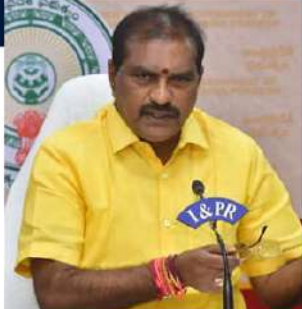
అబద్ధాలకు వీసీపీ.. అవినీతిలో అనకొంద

సం అన్ని జగన్ ఆరాచక పాలన లోపాల్ అని ఘాటంగా విమర్శించారు. గత జగన్ పాలనలో ప్రభుత్వం తుదిదాని ఫిబ్రవరి 29వ తేదీన 41.15 మీటర్ల ఎత్తుకు పోలవరం ప్రాజెక్టును నిర్మిస్తామని కేంద్రానికి ప్రతిపాదన పంపగా రిజిస్ట్రేషన్ కమిటీ రూ.47వేల 617 కోట్లు అమోదం తెలిపింది, ఈ ప్రకారం కేంద్ర కేబినెట్ పోలవరానికి రూ.12వేల 157 కోట్లు మంజూరు చేసిందిని తెలిపారు. కానీ వైసీపీ నేతలు పోలవరం ప్రాజెక్టుపై విషంవిమ్మడం తో పాటు, వారికి చెందిన సాక్షి పత్రిక సత్యం ప్రజలను తప్పుదోవ పట్టించేవిధంగా విషపూ రాలలు రాల్చారని దుయ్యబట్టారు. గత ప్రభుత్వం పోలవరం ప్రాజెక్టును, దయాభ్రంహాలను విధ్వంసం చేస్తే, కూటమి ప్రభుత్వం అధికారంలోకి వచ్చిన తరువాత సీఎం చంద్రబాబు నేతృత్వంలో పోలవరం ప్రాజెక్టులో దయాభ్రం వారే పునర్నిర్మాణంలో పాలు, అతర పనులను తిరిగి ప్రారంభించామని మంత్రి నిమ్మల స్పష్టం చేశారు.