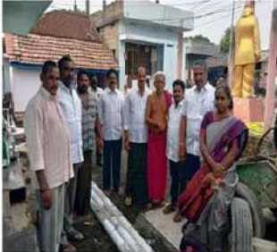
కమ్మూనిటీ హాలుకు సైకిల్ రూ. 10 లక్షల గ్రాంట్ మంజూరు చేయడం వాటి పనులు కూడా త్వరలోనే ప్రారంభిస్తామని వెల్లడించారు.