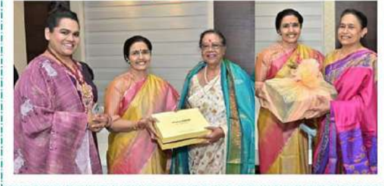
అమరావతిలోని అమర్-శర్మదీ దర్శనానికి హాజరైన మాజీ రాష్ట్రపతి రామ్ నాథ్ కోవింద్ దంపతులు రాజ్ భవన్ లోని గవర్నర్ అబ్దుల్ నజీర్ ఆతిథ్యం తీసుకున్నారు. మాజీ రాష్ట్రపతి రామ్ నాథ్ దంపతులను శుక్రవారం రాజ్ భవన్ లో ముఖ్యమంత్రి చంద్రబాబు నాయుడు దంపతులు.