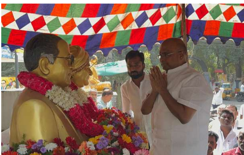
ఎన్టీఆర్ కు టీడీపీ నేత కోవెలమూడి రవీంద్ర నివాళి