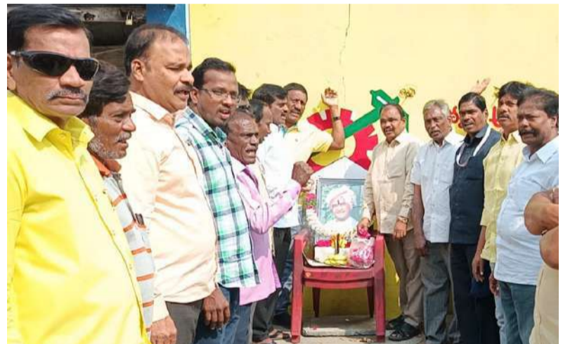
గుంటూరు తూర్పు నియోజకవర్గంలో