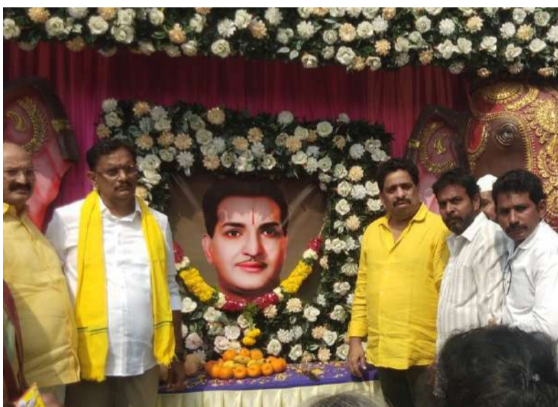
విజయవాడలో నివాళులర్పిస్తున్న టీడీపీ నేతలు