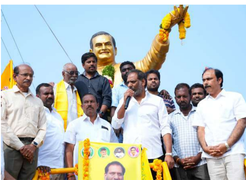
అద్దంకిలో నివాళులర్పిస్తున్న మంత్రి గొట్టిపాటి రవి