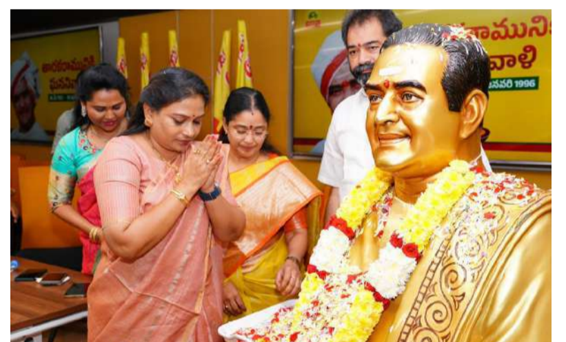
ఎన్టీఆర్ కు నివాళులర్పిస్తున్న హోంమంత్రి అనిత