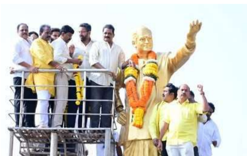
విశాఖలో నివాళులర్పిస్తున్న టీడీపీ నేతలు