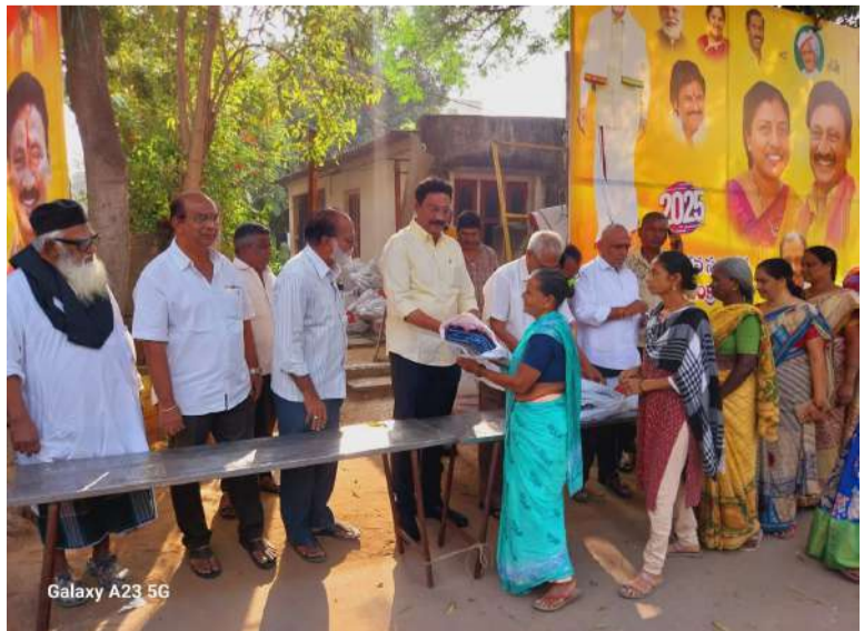
విజయవాడలో పేదలకు బట్టలు పంపిణీ చేస్తున్న గద్దె