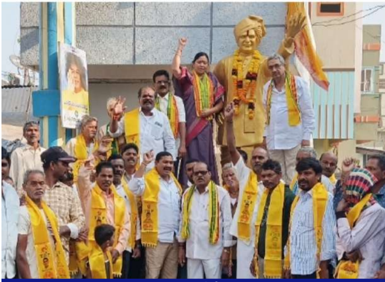
పాలకొండ నియోజకవర్గంలో టీడీపీ నాయకులు నివాళులు