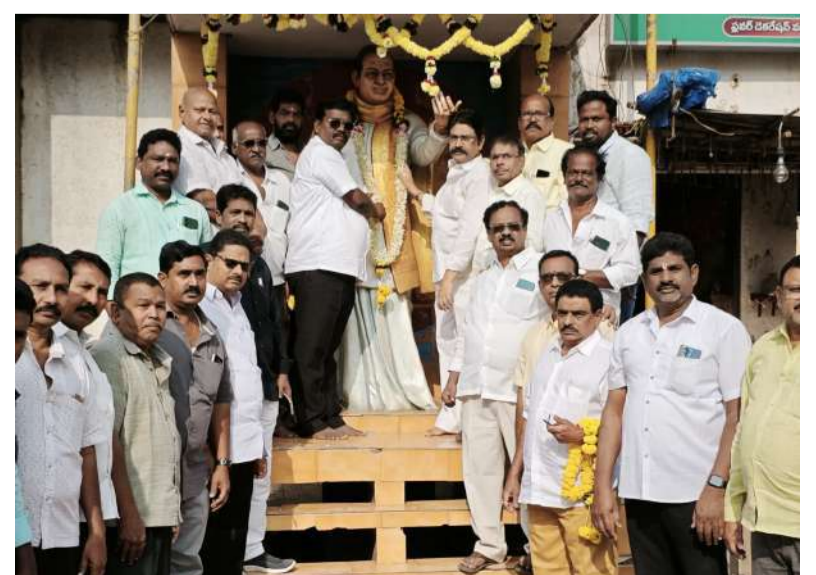
అమలాపురంలో నివాళులర్పిస్తున్న అయితాబత్తుల