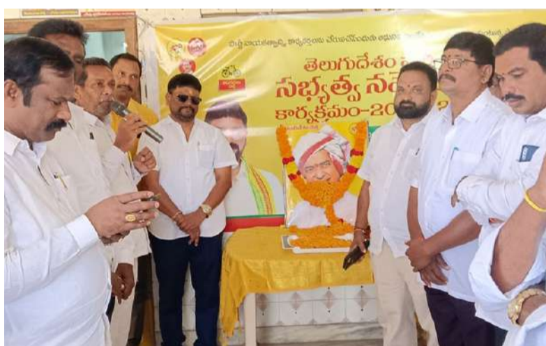
రాజాంలో ఎన్టీఆర్ కు నివాళులర్పిస్తున్న శ్రేణులు