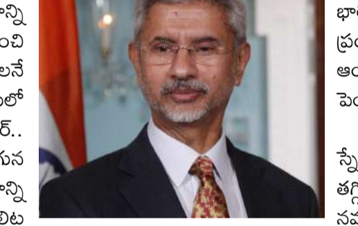
దేశ ప్రయోజనాలను దృష్టిలో ఉంచుకొని ముందుకు వెళ్తున్నట్లు పేర్కొన్నారు. పరస్పర గౌరవం, ప్రయోజనాలు, సువృద్ధావ సంబంధాలు అనే మూడు అంశాలే భారత దౌత్య విధానమని స్పష్టం చేశారు. గత పదేళ్లలో వివిధ దేశాలతో జరిగిన ఒప్పందాలు, ప్రపంచ వేదికలపై భారత్కు దక్కిన గుర్తింపే అందుకు నిదర్శనమని చెప్పారు.

పాకిస్థాన్పై భారత విదేశాంగశాఖ మంత్రి జైశంకర్ మరోసారి విరుచుకుపడ్డారు. ఉగ్రవాదాన్ని ‘క్వాస్సర్’ వ్యాధితో పోల్చిన ఆయన.. పాక్ పెంచి పోషించిన ఉగ్రవాదం ఇప్పుడు ఆ దేశ ప్రజలనే కబళిస్తోందని విమర్శించారు. ముంబయిలో నిర్వహించిన ఓ కార్యక్రమంలో పాల్గొన్న జైశంకర్.. దాయాదిపై విమర్శలు గుప్పించారు. మన పొరుగున ఉన్న పాకిస్థాన్ సీమాంతర ఉగ్రవాదాన్ని ప్రోత్సహిస్తోంది. అదే ఇప్పుడు వారి పాలిట శాపమైంది. అది క్రమంగా ఆ దేశ రాజకీయాల్లోకి ప్రవేశిస్తోంది. సీమాంతర ఉగ్రవాదాన్ని అణచివేయాలని భారత్ సహా పలుదేశాలు కోరుతున్నాయి.” అని జైశంకర్ తెలిపారు.