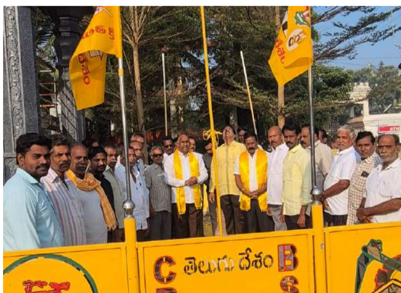
ఉండ్రాజవరం మండలంలో బూరుగుపల్లి శేషారావు నివాళి