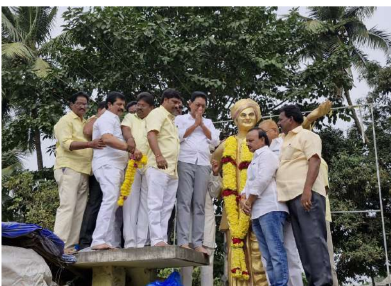
రాజోలులో కారణజన్నుడు ఎన్టీఆర్ కు నివాళి