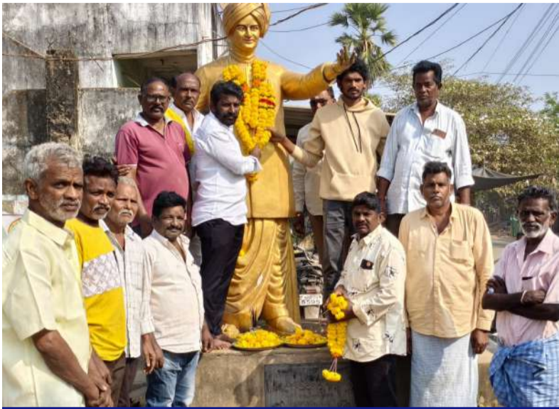
జంగారెడ్డిగూడెం శ్రీనివాసపురంలో ఘన నివాళి