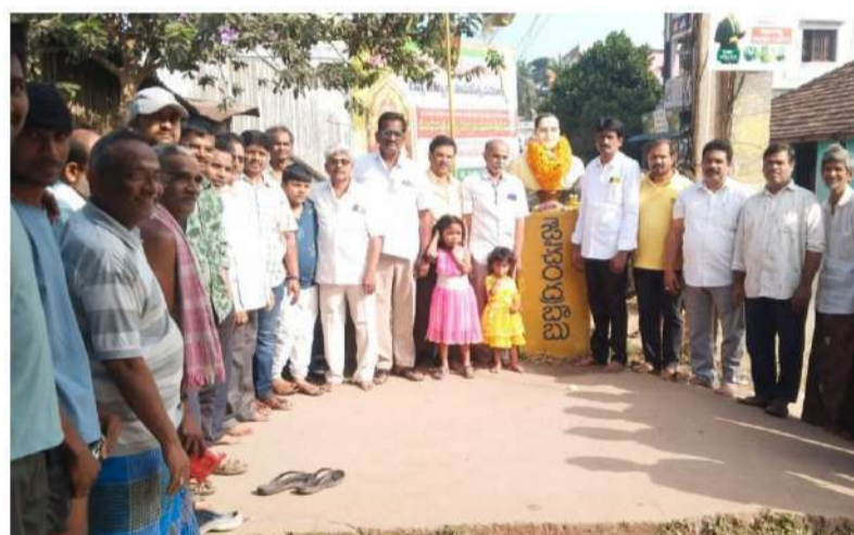
పి.గన్నవరంలో నివాళులర్పిస్తున్న శ్రేణులు