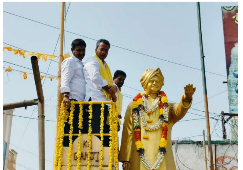
మైలవరంలో ఎన్టీఆర్ విగ్రహానికి నివాకులర్పిస్తున్న వసంత