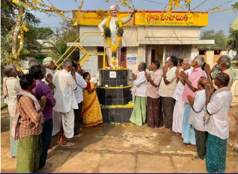
గన్నవరం నియోజకవర్గం రంగన్నగూడెం