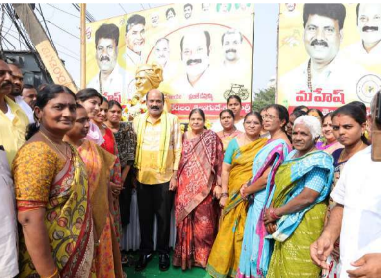
గన్నవరంలో నివాకులర్పిస్తున్న ఎమ్మెల్యే యార్లగడ్డ