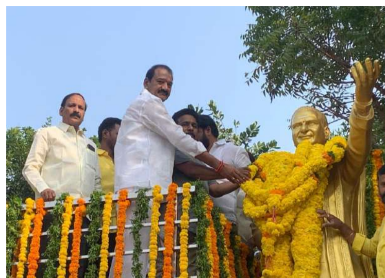
గన్నె ప్రసాద్ ఆధ్వర్యంలో ఎన్టీఆర్ కు నివాళులర్పిస్తున్న చిత్రం