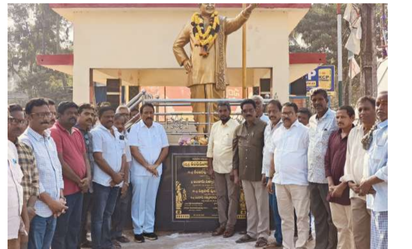
గోపాలపురంలో ఎన్టీఆర్ కు నివాళులు