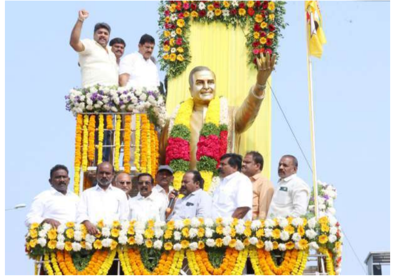
పొన్నూరు నియోజకవర్గం పెదకాకానిలో ధూళిపాళ్ల