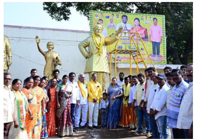
రంపచోడవరంలో నివాళులర్పిస్తున్న ఎమ్మెల్యే శిరీష