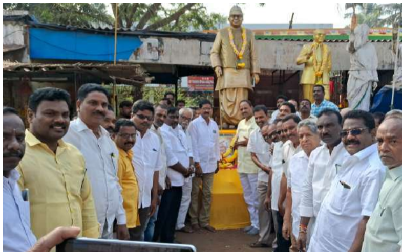
మామిడికుదురులో నివాళులర్పిస్తున్న శ్రేణులు