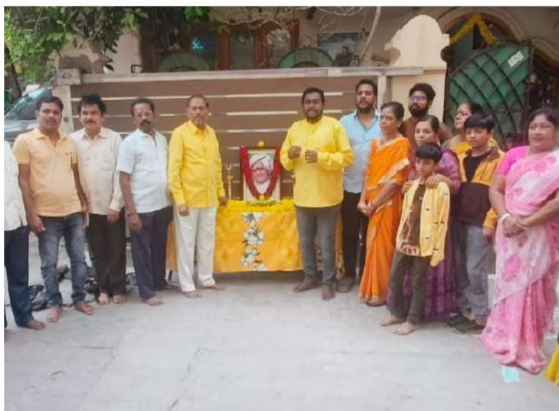
ధర్మవరంలో నివాళులర్పిస్తున్న టీడీపీ నేతలు