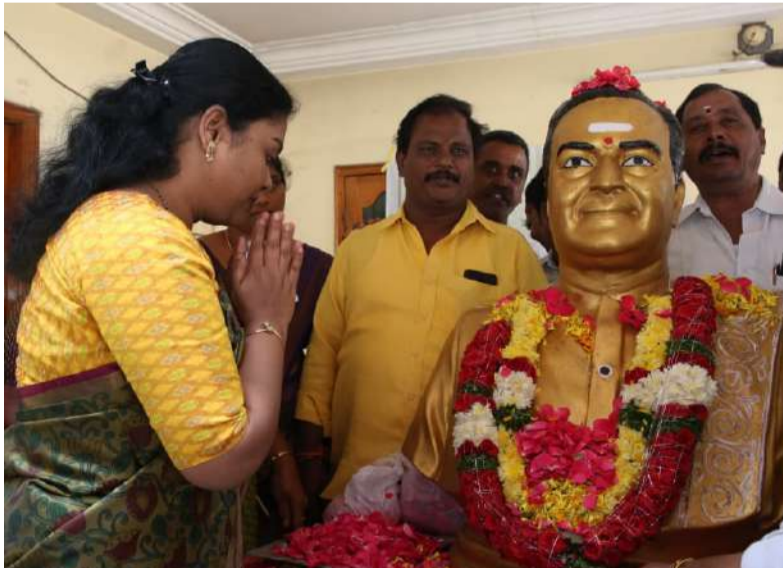
నందిగామలో నివాకులర్పిస్తున్న తంగిరాల సౌమ్య