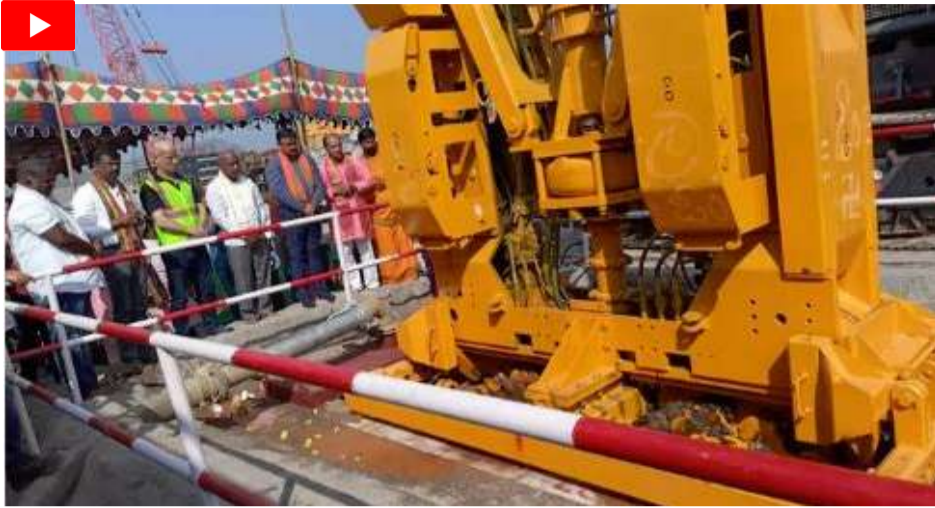
నిర్మాణం చేపట్టేందుకు ప్రభుత్వం కార్యాచరణ షెడ్యూలు జారీ చేసింది. కొత్త డయాఫ్రం వాల్ కోసం రూ.990 కోట్లు ప్రభుత్వం వెచ్చించనుంది.

పోలవరం (చైతన్య రథం): పోలవరం ప్రాజెక్టులో కీలకమైన డయాఫ్రం వాల్ నిర్మాణ పనులు ప్రారంభమయ్యాయి. ఇందుకు సంబంధించిన పనులను కాంట్రాక్టు సంస్థ ప్రారంభించింది. 1396 కిలోమీటర్ల పొడవైన డయాఫ్రం వాల్ నిర్మాణం కోసం ప్రణాళికలు రూపొందించారు. 1.5 మీటర్ల మందం తో నది ప్రవాహ మార్గంలో భూమి లోపల దీని నిర్మాణం చేపట్టనున్నారు. పాత డయాఫ్రమ్ వాల్ కు 6 మీటర్ల ఎగువన కొత్త నిర్మాణం చేపట్టనున్నారు. సగం నిర్మాణం పూర్తికాగానే సమాంతరంగా దాని పైన ఎర్త్ కం రాక్ ఫిల్ డ్యాం