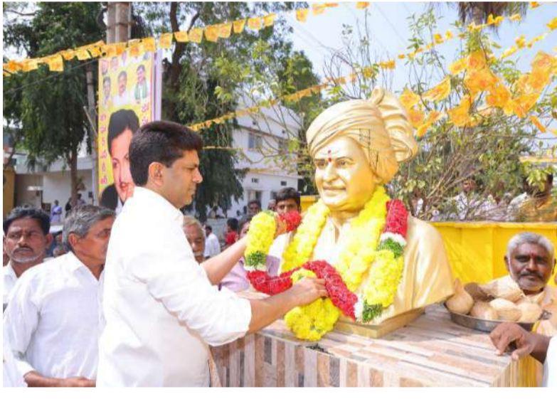
తెనాలిలో నివాకులర్పిస్తున్న కేంద్రమంత్రి పెమ్మసాని