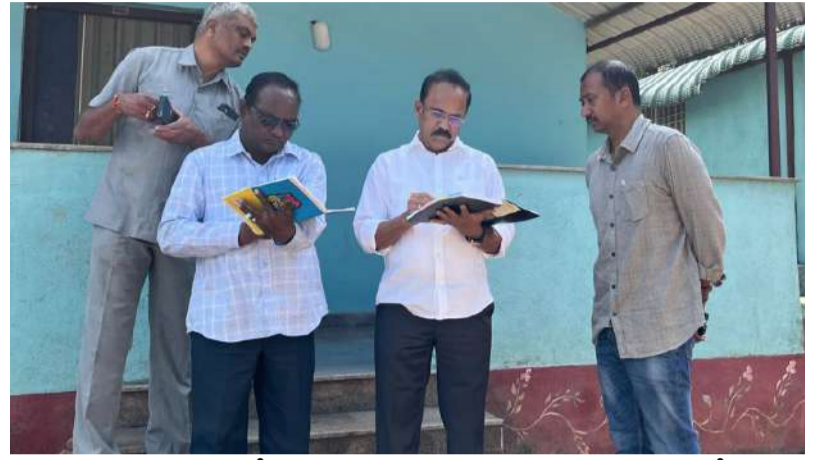
అంశంపై అవసరమైతే ముఖ్యమంత్రిని కలిసి వినతిపత్రం అందజేస్తామని తెలిపారు. చివరగా, పర్యాటక శాఖ సిబ్బంది కోరిక మేరకు యూనిఫాం, బూట్లు త్వరలోనే అందజేస్తామని హామీ ఇచ్చారు.

ఆ స్థలాన్ని కార్యక్రమాల నిర్వహణకు వినియోగించాలని సూచించారు. అదనంగా, రెవెన్యూ అతిథి గృహాన్ని పర్యాటక శాఖకు బదలాయించేందుకు కృషి చేస్తామని తెలిపారు. ముఖ్యమంత్రి చంద్రబాబు నాయుడు పర్యాటక రంగానికి ప్రత్యేక ప్రాధాన్యత ఇస్తున్నారన్నారు. పెట్టుబడిదారులకు రాయితీల ప్రోత్సాహకాలు అందించనున్నట్లు వెల్లడించారు. వెయ్యి దర్శన టికెట్లను రద్దు చేయడంపై అసంతృప్తి వ్యక్తం చేశారు. ఈ నిర్ణయం వల్ల నెలకు కోటి రూపాయల ఆదాయం నష్టపోతున్నట్లు పేర్కొన్నారు. ఈ