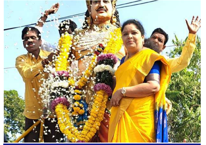
సాలూరులో నివాళులర్పిస్తున్న మంత్రి సంధ్యారాణి