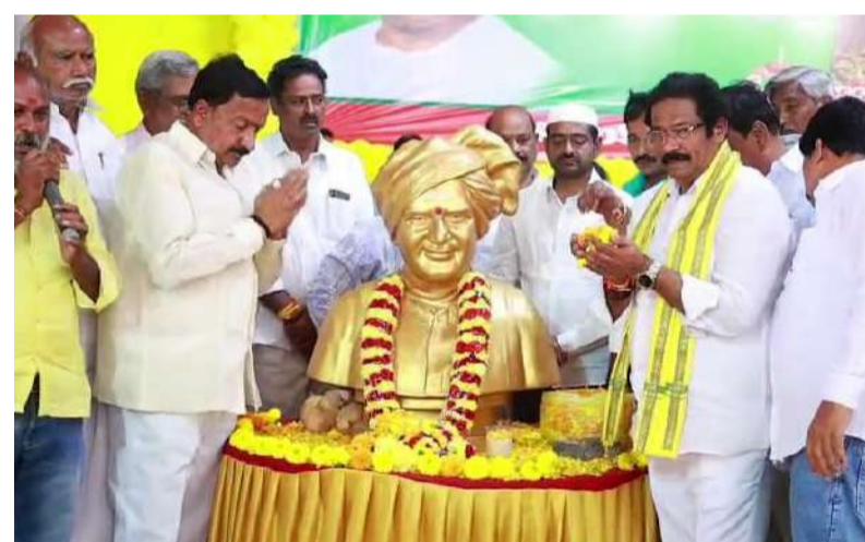
వినుకొండలో నివాళులర్పిస్తున్న జీవీ ఆంజనేయులు