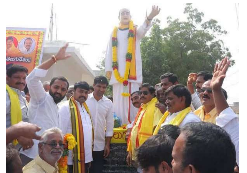
పల్నాడులో నివాళులర్పిస్తున్న టీడీపీ నేతలు