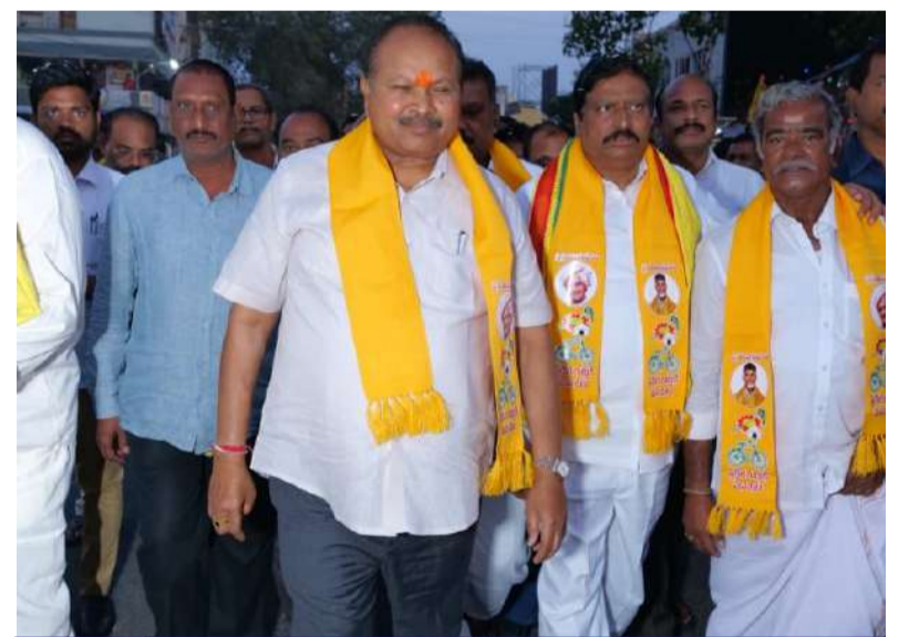
ఎన్టీఆర్ విగ్రహాన్ని ఆవిష్కరించేందుకు వస్తున్న ఎమ్మెల్యే కన్నా