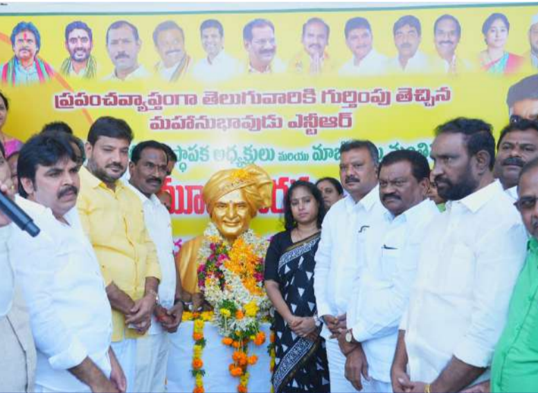
గుంటూరు పార్టీ కార్యాలయంలో నివాకులర్పిస్తున్న ఎమ్మెల్యేలు