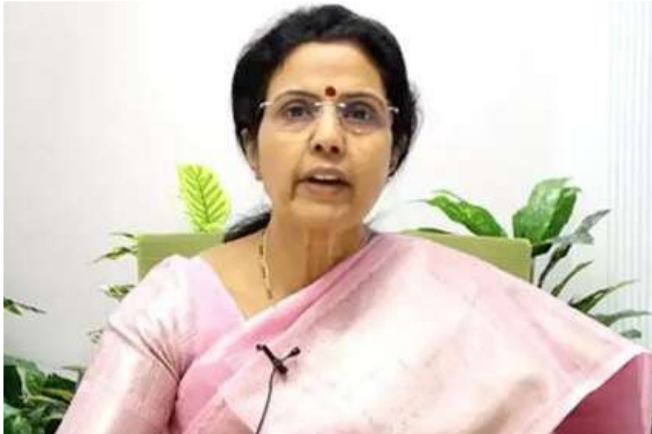
తలసేమియా వ్యాధిపై అవగాహనకు..