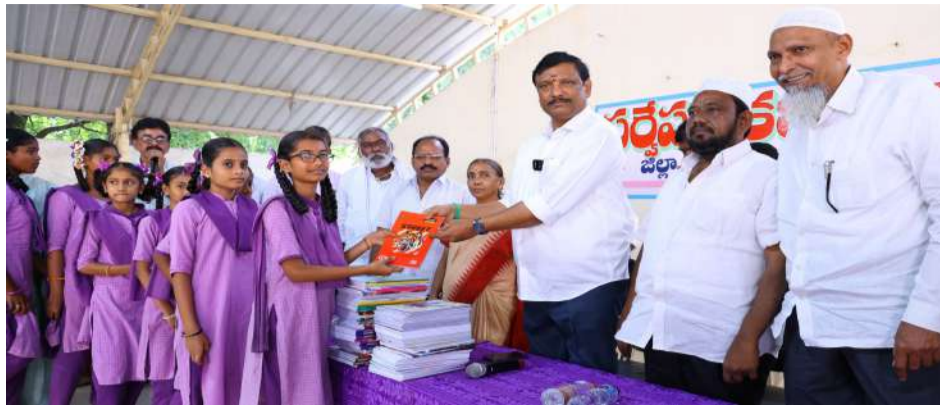
23వ మంత్రి లోకేష్ పుట్టిన రోజు వేడుకలకు

రూ.1.90 కోట్ల విలువైన వస్తువులను త్వరలోనే సెంట్ కార్వ్ కంపెనీ అందజేస్తుందన్నారు. ముత్తుకూరు ప్రాథమిక ఆరోగ్య కేంద్రాన్ని సామాజిక ఆరోగ్య కేంద్రంగా అప్ గ్రేడ్ చేసి అంశాన్ని పరిశీలిస్తున్నామన్నారు. మంత్రి సత్యకుమార్ యాదవ్ సహకారంతో సామాజిక ఆరోగ్య కేంద్రం సేవలను అందుబాటులోకి తేవాలని చూస్తున్నామన్నారు. స్థానికంగా ఉండే ప్రజలతో పాటు పారిశ్రామికీకరణ నేపథ్యంలో ఈ ప్రాంతానికి వేలాదిగా ప్రజలు వస్తున్న నేపథ్యంలో ముత్తుకూరులో సీహెచ్సీ తప్పనిసరి అని భావిస్తున్నామన్నారు. ప్రసవాలను ప్రభుత్వ ఆస్పత్రుల్లోనే చేయించుకునేలా గర్భిణులను చైతన్యవంతం చేయాల్సిన బాధ్యత ఎన్ఎంఎం, ఆశా వర్కర్లు తీసుకోవాలన్నారు. ప్రభుత్వ ఆస్పత్రులకు ఏ అవసరం వచ్చినా సమకూర్చేందుకు తాము సిద్ధంగా ఉన్నామన్నారు.