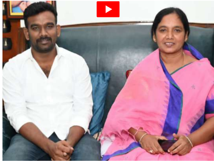
రాష్ట్రాదు (చైతన్యరథం): విశాఖ ఉక్కు పరిశ్రమను 2002లో నష్టాల నుంచి కాపాడింది.. నేడు తీవ్ర ఆర్థిక సంక్షోభం నుంచి