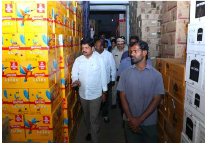
త్వరలోనే నోటిఫికేషన్ జారీ చేస్తామని మంత్రి వెల్లడించారు. లైసెన్సు ఫీజులో 50 శాతం సబ్సిడీ అందించి ఆర్థిక తోడ్పాటు ఇస్తున్నామన్నారు. మద్యం షాపుల కేటాయింపును అత్యంత పారదర్శకంగా నిర్వహించేందుకు చర్యలు తీసుకుంటున్నామని తెలిపారు.

గీత కార్మికుల మద్యం దుకాణాలకు త్వరలో నోటిఫికేషన్ కల్లుగీత కార్మికుల కోసం కేటాయించిన 340 షాపులకు