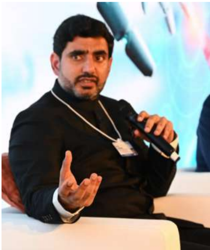
దావోస్ (చైతన్యరథం): నేటి అధునాతన సాంకేతిక యుగంలో సులభతరమైన పాలనా విధానాల అమలు