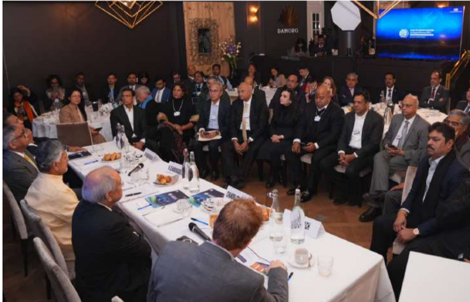
వరల్డ్ ఎకనామిక్ ఫోరమ్ (డబ్ల్యుఈఎఫ్) రెండో రోజున భారత పరిశ్రమల సమాఖ్య (సీఐఐ) ప్రత్యేక సెషన్ లో గ్రీన్ ఇండస్ట్రీలైజేషన్ ప్రసంగిస్తున్న సీఎం చంద్రబాబు నాయుడు

రంగం ఏదైనా.. భారతీయులదే విజయం: చంద్రబాబు