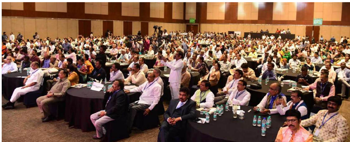
హైదరాబాద్ అభివృద్ధిని నేను ఆనాడే ఊహించా