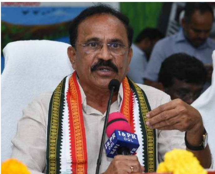
ఓంగోలు, (చైతన్యరథం) : ప్రకాశం జిల్లా 56వ అవతరణ దినోత్సవ వేడుకలు ఆదివారం ఓంగోలు ప్రకాశం భవనంలో