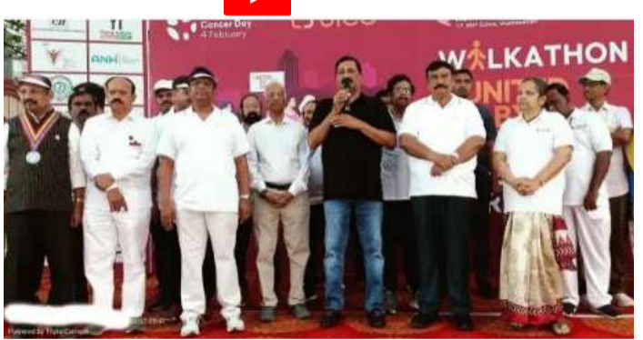
ఆరోగ్య సంస్థలు, మెడికల్ కాలేజీలు, వైద్య సంఘాలతో మొత్తం 3000మంది వాకథాన్లో పాల్గొన్నారు.