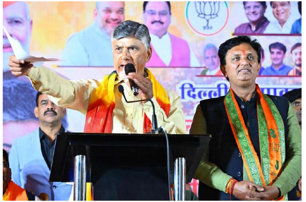
మురికి కూపంగా ఢిల్లీ

ఢిల్లీ అభివృద్ధి కావాలంటే బీజేపీ అధికారంలోకి రావాలి. ఈ దేశానికి రాజధాని అయిన ఢిల్లీ సమస్యల వలయంలో చిక్కుకుపోయి అభివృద్ధికి ఆమడ దూరంలో ఉంది. పదేళ్లు ఏం చేశారని అడిగితే స్కూలు పెట్టామంటున్నారు. చదివిన వారికి ఉద్యోగాలు వచ్చాయా..? ఉద్యోగాలకు బెంగళూరు, హైదరాబాద్ వెళ్లడానికి కారణం ఇక్కడి పాలకులు. దేశం స్వచ్ఛ భారత్ వైపు దూసుకెళ్తుంటే.. ఢిల్లీ మాత్రం మురికి కూపంగా మారుతోంది. సరైన నీటి పైవులైస్తు లేక తాగునీరు కలుషితమౌతోంది. ఒక్కప్పుడు బీహార్ నుంచి ఇక్కడికి ఉపాధికి వచ్చేవారు... కానీ ఇప్పుడు దక్షిణ భారతదేశం వెళ్తున్నారు. అభివృద్ధి జరిగిన చోటకు వలసలు ఉంటాయని సీఎం చంద్రబాబు అన్నారు.