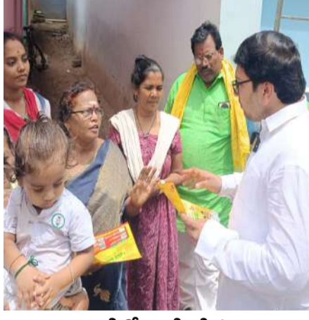
రాజమండ్రిలో ఇంటింటి ప్రచారం చేపడుతున్న నేతలు