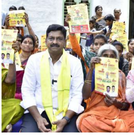
ప్రజలకు అవగాహన కల్పిస్తున్న మంత్రి పర్యాయుల కేశవ్