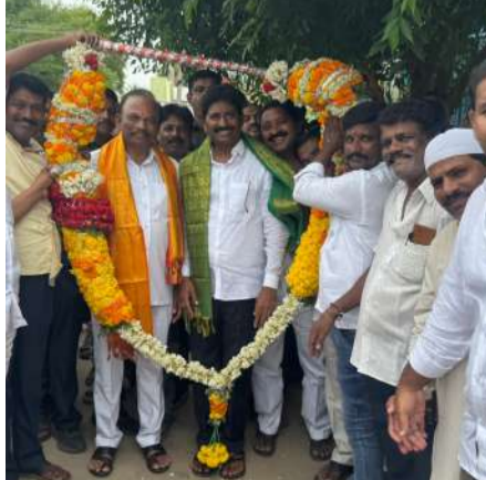
బంగోలులో ప్రచారం నిర్వహిస్తున్న ఎంపీ మాగుంట, ఎమ్మెల్యే ముత్తుముల