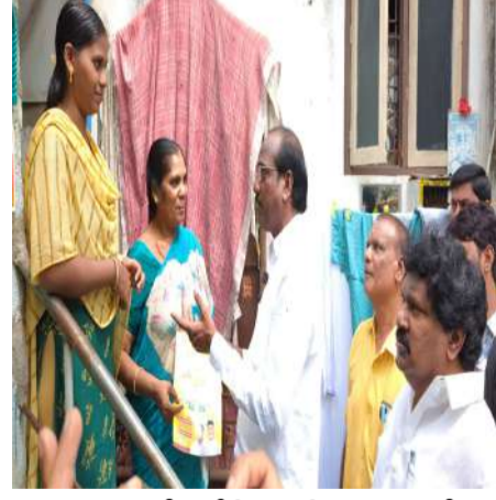
ఏలూరులో బడేబి చంటి ఆధ్వర్యంలో ఇంటింటి ప్రచారం