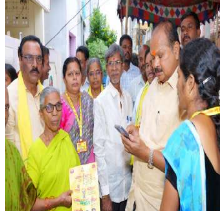
సత్తెనపల్లిలో మై టీడీపీ యాప్ లో వివరాలు పొందుపరుస్తున్న ఎమ్మెల్యే కన్నా