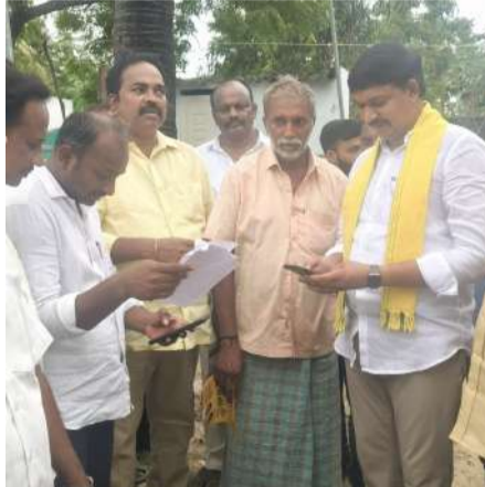
పెదనలో ఏడాది పాలనలో చేపట్టిన సంక్షేమం గురించి వివరిస్తున్న ఎమ్మెల్యే కాగిత