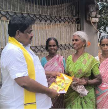
తాడేపల్లిలో ఇంటింటి ప్రచారం చేపడుతున్న టీడీపీ నేతలు