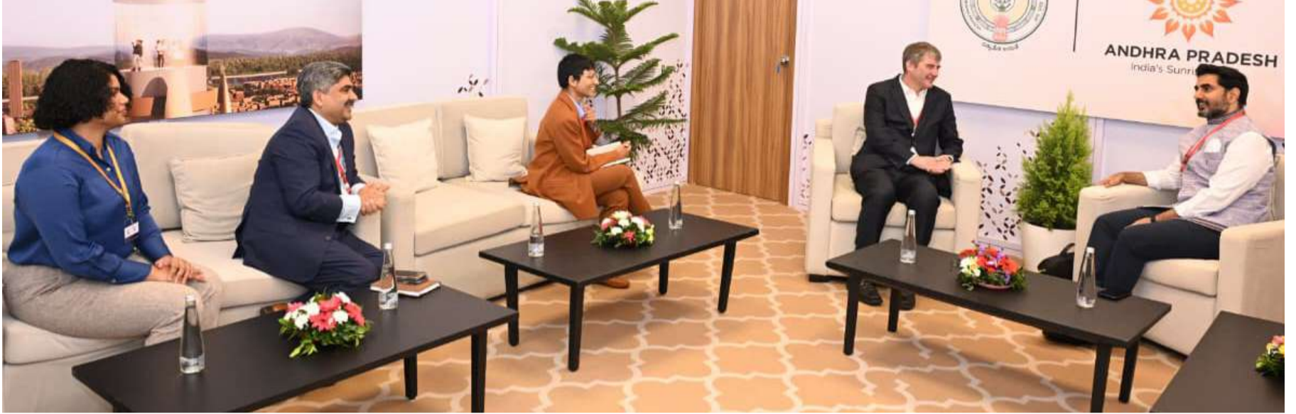
జాతీయ భద్రతలో సైబర్ సెక్యూరిటీ కీలకం

ఈరోజు ప్రపంచం పరస్పరం అనుసంధానమైన నేపథ్యంలో సైబర్ సెక్యూరిటీ జాతీయభద్రతలో కీలకం. అక్టోబర్ 2023 నుండి సెప్టెంబర్ 2024వరకు, భారతదేశంలో 369 మిలియన్లకి పైగా సైబర్ సెక్యూరిటీ ఘటనలు గుర్తించారు. ప్రపంచవ్యాప్తంగా 2033 నాటికి సైబర్ దాడులు సుమారు 1 ట్రిలియన్ డాలర్ల నష్టాలను కలిగించనుందని అంచనా. ఇవి చాలా ఆందోళనకరమైన అంశం. ఇవి కీలకమైన మౌలిక సదుపాయాలకు అడ్డంకులు సృష్టించి, ఆర్థిక అభివృద్ధి ప్రతిబంధకంగా మారతాయి. ఆంధ్రప్రదేశ్ ఐటీ హబ్ గా అభివృద్ధి చెందుతోంది. మరాఠ్ లో పరిశ్రమలు, రవాణా, విద్యుత్ రంగాలు వేగంగా అభివృద్ధి సాధిస్తున్నాయి. ఈ ప్రయోజనం సజావుగా సాగాలంటే బలమైన సైబర్ సెక్యూరిటీ అవసరం. ఇదే సమయంలో, మాకు ఒక అనుకూల అంశం కూడా ఉంది. మా విద్యార్థుల 70% STEM కార్యక్రమాల్లో చేరుతున్నారు. ఇది స్వదేశీ సైబర్ సెక్యూరిటీ నిపుణులను తయారుచేసుకునేందుకు