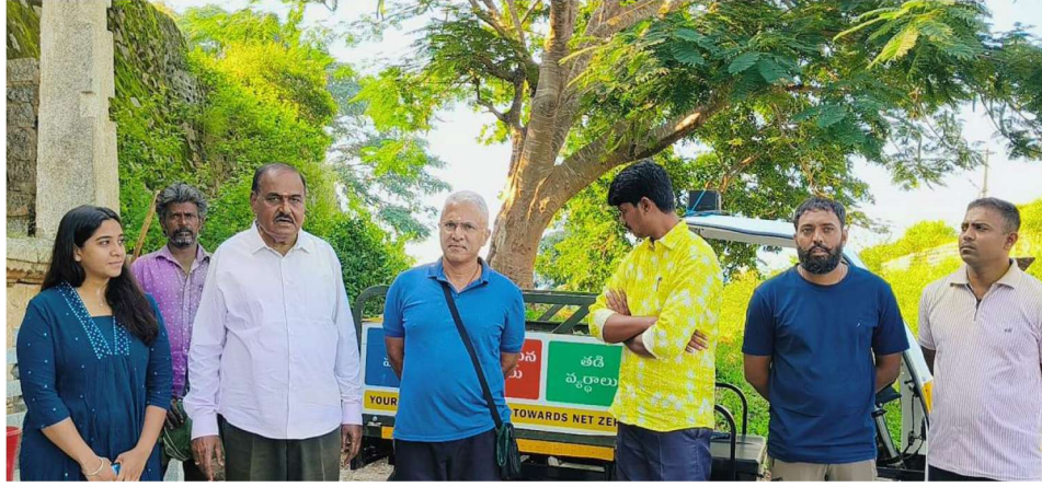
కుప్పం నియోజకవర్గంలోని కుప్పం మండలం కంగుంబి కోటలో శనివారం జరిగిన "స్వచ్ఛ ఆంధ్ర, స్వచ్ఛ దివస్" కార్యక్రమంలో పాల్గొన్న టీడీపీ శ్రేణులు