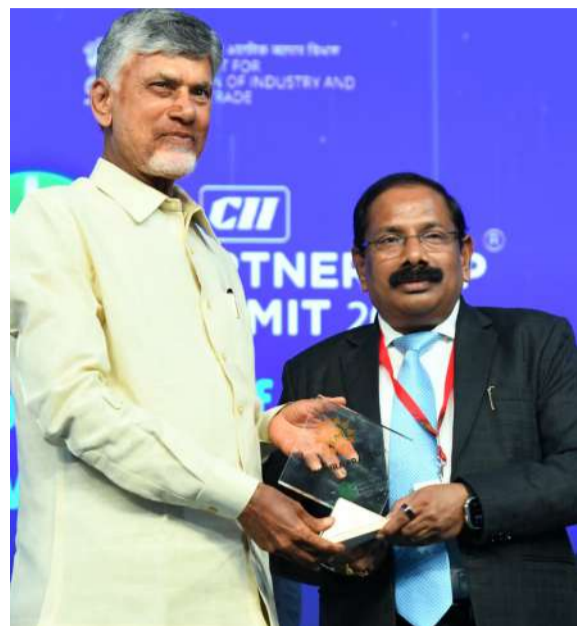
- అందరి టీం వర్క్తోనే సమ్మిట్ విజయవంతం - మంత్రులు, అధికారులు, ఉద్యోగులకు సీఎం చంద్రబాబు అభినందనలు

విశాఖపట్నం (చైతన్యరథం): విశాఖపట్నంలో నిర్వహించిన సీఐఐ భాగస్వామ్య సదస్సు అంచనాలకు మించి విజయవంతమయిందని ముఖ్యమంత్రి చంద్రబాబు నాయుడు సంతోషం వ్యక్తం చేశారు. మంత్రులు, అధికారుల టీం వర్క్ తోనే సమ్మిట్ సూపర్ హిట్ అయిందన్నారు. ఐదేళ్లలో రూ.50 లక్షల కోట్ల పెట్టుబడులే లక్ష్యంగా ముందుకు వెళు తున్నామని స్పష్టం చేశారు. విశాఖ సీఐఐ భాగస్వామ్య సదస్సు అనంతరం మంత్రులు, అధికారులు, ఉద్యోగు లకు సీఎం అభినందనలు తెలిపారు. అవార్డులు అందించి... ప్రశంసించారు. ఈ సందర్భంగా సీఎం చంద్రబాబు మాట్లాడుతూ సీఐఐ, కేంద్ర, రాష్ట్ర ప్రభుత్వాలు సంయుక్తంగా విశాఖలో నిర్వహించిన భాగస్వామ్య సదస్సును జయప్రదం చేసిన ప్రతి ఒక్కరినీ మనస్ఫూర్తిగా అభినందిస్తున్నానన్నారు. 45 దేశాల్లో మన సమ్మిట్ చర్చవీయాంశమైందంటే, విశాఖ పేరు మార్మోగుతోందంటే టీం వర్క్ తోనే ఇది సాధ్యమైంది. ఈ సదస్సులో అద్భుతమైన, విజ్ఞాన వంతమైన చర్చలు జరిపాం. దావోస్ లో ఎంవోయూలు బయట జరుగుతాయి. ప్రపంచం ఏదిశగా ముందుకు వెళుతోంది, భవిష్యత్ ఏవిధంగా ఉంటుంది, ఎదురయ్యే సవాళ్లు, అందివచ్చే అవకాశాలపై మెయిన్ వెన్యూలో చర్చిస్తారు. కానీ విస్తృత పద్ధతిలో విశాఖ సమ్మిట్ కు మనం శ్రీకారం చుట్టాం. ఎవరికి ఏ సబ్జెక్ట్ పైన ఆసక్తి ఉంటే ఆ సెమినార్ కు వెళ్లే అవకాశం కల్పిం చాం. సమ్మిట్ లో వెన్యూ మొదలుకొని మేనూ వరకూ అంతా ఫ్లానింగ్ తో నిర్వహించారు. విదేశీ