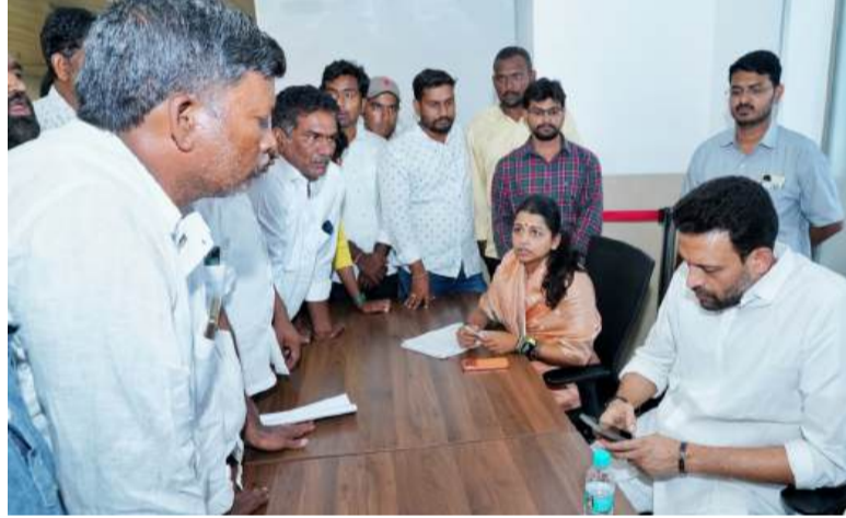
అధికారులు, ప్రజా ప్రతినిధులు పని చేస్తున్నారు. వారిపై చర్యలు తీసుకుని నిధులను రికవరీ చేయాలి.

మంగళగిరి (చైతన్యరథం): మంగళగిరిలోని తెలుగుదేశం పార్టీ కేంద్ర కార్యాలయంలో శనివారం ప్రజా వినతుల పరిష్కార వేదిక నిర్వహించారు. రాష్ట్రం నలుమూలల నుంచి విచ్చేసిన వారి నుంచి మంత్రి బీజే భరత్ గుప్తా, ఎమ్మెల్యే కావలి గ్రీష్మ వినతులు స్వీకరించి వాటి పరిష్కారానికి కృషి చేశారు.