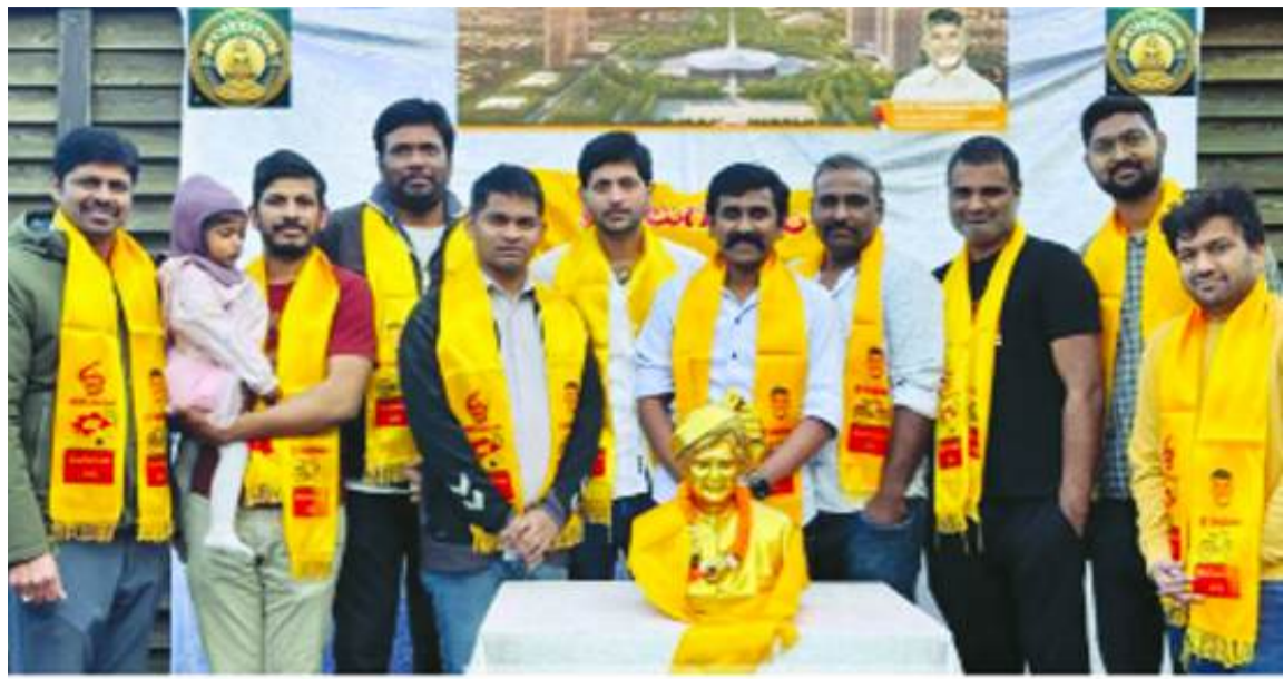
యురప్లోని డెన్వార్క్లో ఎన్టీఆర్ విగ్రహం వద్ద సంబరాలలో పాల్గొన్న తెలుగు యువత