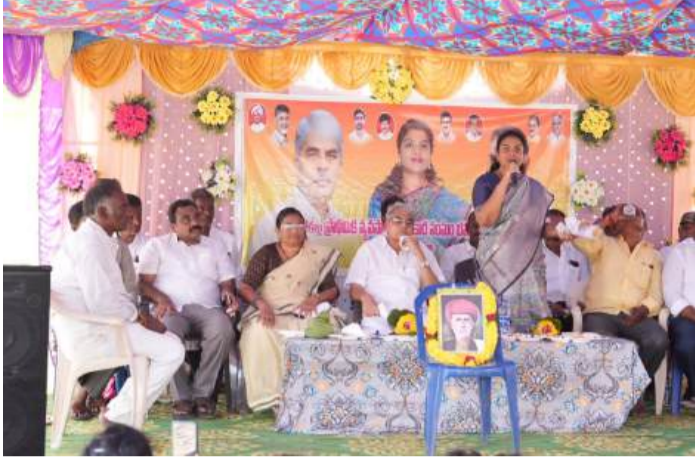
నందిగమ (చైతన్యరథం): చంద్రపాడు మండలం, కొడవటికల్లు గ్రామంలో శనివారం జ్యోతిరావు పూలే