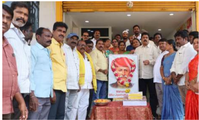
విజయవాడ (చైతన్యరథం): స్థానిక సింగ్ నగర్లోని సెంట్రల్ నియోజకవర్గ ఎమ్మెల్యే కార్యాలయంలో మహాత్మా జ్యోతిరావు

నివాళులర్పించిన ఎమ్మెల్యే బొండా ఉమామహేశ్వరరావు