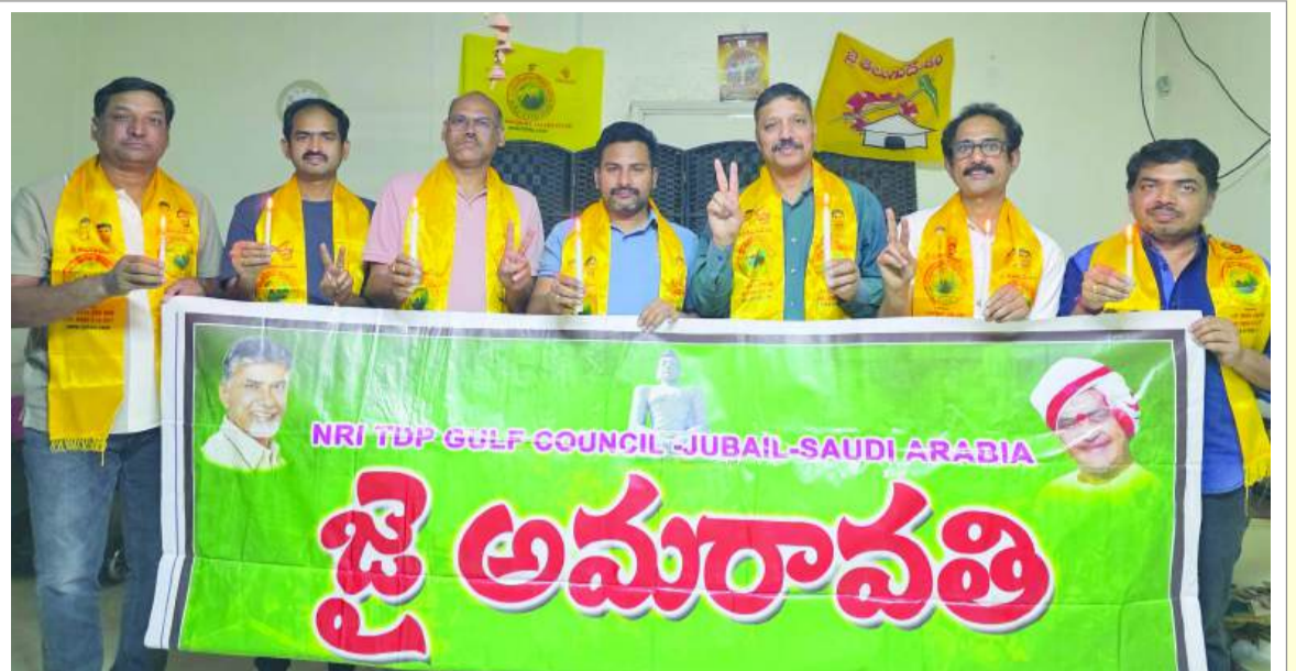
సౌదీ అరేబియాలో జై అమరావతి నివాదాలు చేస్తున్న ప్రవాసాంధ్రులు

డెన్వార్క్ (యురప్): ఆంధ్రప్రదేశ్ శాశ్వత రాజధానిగా అమరావతి నిర్ణయంపై బిల్లు పార్లమెంటులో ఆమోదం పొందిన సందర్భంగా యురప్లోని డెన్వార్క్లో తెలుగు యువత ఆధ్వర్యంలో భారీ సంబరాలు నిర్వహించారు. అమరావతికి లభించిన మద్దతుపై అక్కడి ప్రవాసాంధ్రులు సంతోషం వ్యక్తం చేశారు. భారత జెండాలు, అమరావతి పోస్టర్లు, బ్యానర్లతో వేడుక జరిగిన ప్రాంగణం కళకళలాడింది. యువత, కుటుంబ సభ్యులు అందరూ సంప్రదాయ దుస్తులు ధరించి ఉత్సాహంగా పాల్గొన్నారు. ఆ ప్రాంతమంతా నివాదాలు, శుభాకాంక్షలతో మార్యోగింది. అందరికీ మిత్రాన్ని పంచుకుంటారు.