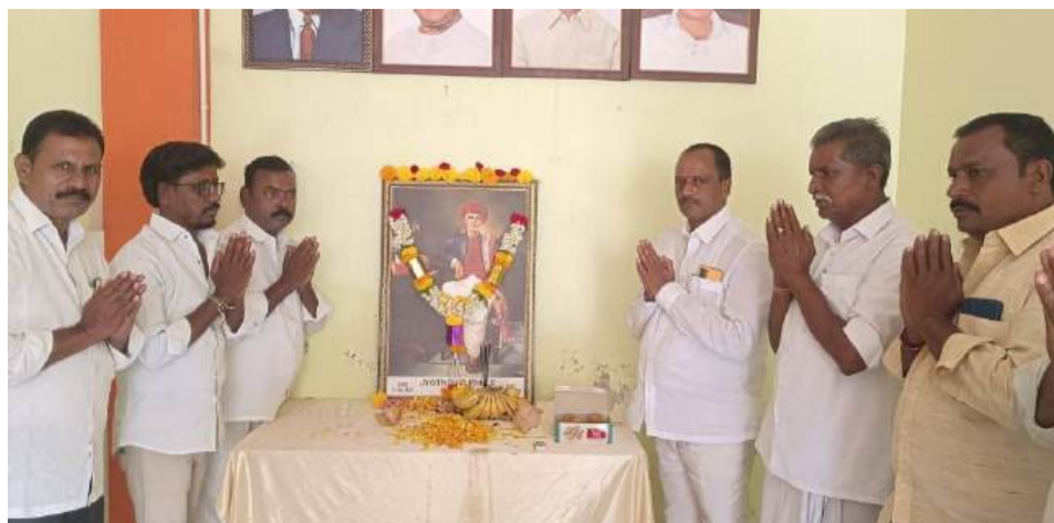
నార్వల తెలుగుదేశం పార్టీ కార్యాలయంలో జ్యోతిరావ్ పూలే చిత్రపటానికి పూలమాలలు వేసి ఘనంగా జయంతి వేడుకలు నిర్వహించారు.