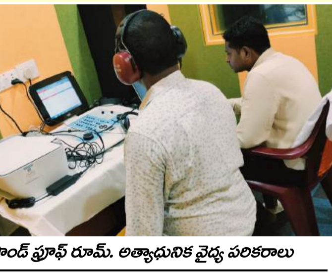
పాలకొండ ఏరియా హాస్పిటల్లోని సౌండ్ ఫ్రూప్ రూమ్. అత్యాధునిక వైద్య పరికరాలు