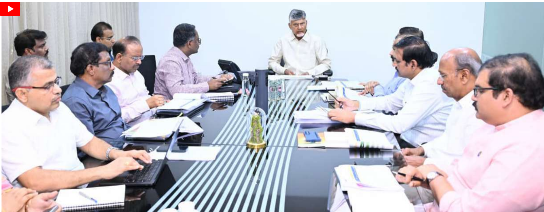
పార్టీ ఇచ్చేలా చూడాలని సీఎం సూచించారు.

అమరావతి (చైతన్య రథం): స్వచ్ఛాంధ్ర సాకారం కావడానికి నిర్దేశించుకున్న లక్ష్యాలు నిర్ణీత సమయానికి పూర్తయ్యేలా పటిష్ట కార్యాచరణ అమలు చేయాలని అధికారులకు ముఖ్యమంత్రి నారా చంద్రబాబు నాయుడు ఆదేశించారు. లక్ష్యాలు చేరుకోవడంలో విఫలమైతే... కారణాలు అన్వేషించి చర్యలు తీసుకోవాలని స్పష్టం చేశారు. క్యాంపు కార్యాలయంలో 'స్వచ్ఛాంధ్ర-స్వచ్ఛాంధ్ర' పురోగతిపై ముఖ్యమంత్రి సమీక్ష నిర్వహించారు. సమీక్షలో ఈ ఏడాది మార్చి 31 వరకు రూపొందించిన స్వచ్ఛాంధ్ర-స్వచ్ఛాంధ్ర ర్యాంకులను అధికారులు ముఖ్యమంత్రికి వెల్లడించారు. విశాఖపట్నం, విజయనగరం, గుంటూరు జిల్లాలు స్వచ్ఛాంధ్రలో మొదటి మూడు స్థానాల్లో ఉండగా... శ్రీ సత్యసాయి, పార్వతీపురం మన్యం, ఏఎన్ఆర్ జిల్లాలు చివరి మూడు స్థానాల్లో ఉన్నట్లు తెలిపారు. ఇందులో విశాఖ జిల్లాకు 92 శాతం, విజయనగరం, గుంటూరు జిల్లాలకు 85 శాతం మార్కులు వచ్చాయి. అట్టడుగున ఉన్న ఏఎన్ఆర్ జిల్లాకు కేవలం 53 శాతం మార్కులు మాత్రమే వచ్చాయి. డోర్ టు డోర్ కలెక్షన్, తడి చెత్త-పొడి చెత్త వేరు చేయడం, వ్యక్తిగత మరుగుదొడ్లు, ఓడీఎఫ్ ప్లస్ మోడల్ వంటివి ర్యాంకులకు ప్రాతిపదికగా తీసుకున్నట్లు చెప్పారు.. అయితే ఇకపై జిల్లాలకు స్వచ్ఛాంధ్ర ర్యాంకులు థర్డ్