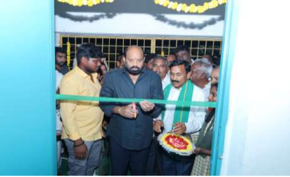
దాతలను ఆయన అభినందించారు. చదివిన పాఠశాలకు సహాయం చేయడం గొప్ప విషయమని పేర్కొన్నారు. వచ్చే విద్యా సంవత్సరానికి స్కూల్ డ్రాపౌట్స్ తగ్గించి, ప్రతి విద్యార్థికి మంచి విద్య అందేలా చర్యలు తీసుకుంటామని చెప్పారు.

పాఠశాలకు వెళ్లేందుకు ఇబ్బందులు పడేవారని చెప్పారు. ఎన్నికల సమయంలో ఇచ్చిన హామీ మేరకు అధికారంలోకి వచ్చిన వెంటనే నిధులు మంజూరు చేసి రోడ్ల నిర్మాణ పనులు పూర్తి చేశామని తెలిపారు. ఈ క్రమంలో చీన-16 నుండి ఎస్సీ కాలనీ వరకు రూ.80 లక్షలు, హైస్కూల్ రోడ్డుకు రూ.21 లక్షలు, బీసీ కాలనీ నుండి ఎస్టీ కాలనీ వరకు రూ.40 లక్షలు, కొత్త వేలేరు సీసీ రోడ్డుకు రూ.11 లక్షలతో పనులు చేపట్టి పూర్తి చేసినట్లు వివరించారు. పాఠశాల అభివృద్ధికి విరాళాలు అందించిన