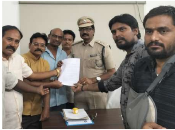
సమాజంలో శాంతి, సామరస్యాలను కాపాడడం అత్యంత ముఖ్యమని, మీడియా బాధ్యతాయుతముగా వ్యవహరించాలని కోరారు.

ప్రజల్లో భయం, అస్థిరత సృష్టించేలా ఉందని అభిప్రాయపడ్డారు. ముఖ్యంగా “స్వీయ రక్షణ”, “ప్రత్యక్ష పోరాటం” వంటి వ్యాఖ్యలు ప్రజలను హింస వైపు దారి తీసే అవకాశముందని ఆందోళన వ్యక్తం చేశారు. ఈ నేపథ్యంలో, చట్టప్రకారం కేసు నమోదు చేసి, సాక్షి టీవీకు సంబంధించిన బాధ్యులపై తక్షణమే దర్యాప్తు చేపట్టాలని, అలాగే ఆ వీడియోను తొలగించేలా చర్యలు తీసుకోవాలని ఎస్పీని కోరారు.