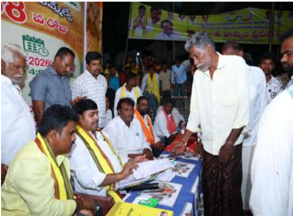
వారి కుటుంబాలతో మాట్లాడారు. కార్యకర్తలకు ఎలాంటి సమస్య తలెత్తినా వారికి అండగా నిలుస్తామని భరోసా కల్పించారు. కార్యక్రమంలో అమరావతి మండల పార్టీ అధ్యక్షులు, గ్రామ అధికారులు, గ్రామ నాయకులు తదితరులు పాల్గొన్నారు.

విద్యుత్ సమస్యలు తలెత్తకుండా చర్యలు తీసుకోవాలని ఆదేశించారు. కూటమి ప్రభుత్వం అమలుచేస్తున్న సంక్షేమ పథకాలు అర్హులైన ప్రతి ఒక్కరికీ అందేలా పనిచేయాలని సూచించారు. గ్రామ ప్రజలతో మమేకమై వారి సమస్యలను త్వరితగతిన పరిష్కరించేలా పనిచేయాలన్నారు. గ్రామ నాయకులతో సమావేశమై కలిసి కట్టుగా పార్టీ బలోపేతానికి కృషి చేయాలని సూచించారు. రానున్న స్థానిక సంస్థల ఎన్నికల్లో కూటమి అభ్యర్థుల గెలుపే లక్ష్యంగా కృషి చేయాలన్నారు. గ్రామంలోని కార్యకర్తల ఇళ్లలో జరిగిన కార్యక్రమాల నేపథ్యం వారి ఇంటికి వెళ్లి