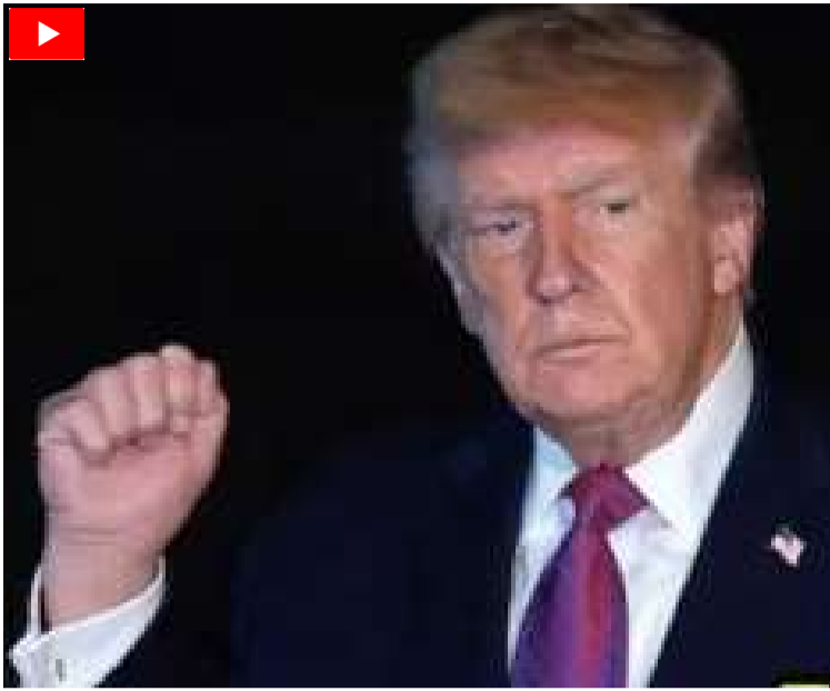
సిద్ధంగా ఉన్నాం' అని ట్రంప్ ప్రకటించారు. మంగళవారం ఇస్లామాబాద్లో ఇరాన్, అమెరికా

అమెరికా: ఇరాన్-అమెరికా మధ్య మరోసారి కాల్పుల విరమణ పొడిగింపు న్నట్లు అమెరికా అధ్యక్షుడు డొనాల్డ్ ట్రంప్ తెలిపారు. ప్రస్తుతం అమల్లో ఉన్న తాత్కాలిక కాల్పుల విరమణ ఒప్పందం ముగింపు దశకు చేరుకోవడంతో కొన్ని గంటల ముందు ఆయన ఈ ప్రకటన చేశారు. బుధవారంతో ఇరు దేశాల మధ్య గతంలో ప్రకటించిన రెండు వారాల గడువు కాల్పుల విరమణ ఒప్పందం ముగియనున్న ఈ నేపథ్యంలో అమెరికా అధ్యక్షుడు ట్రంప్ కీలక వ్యాఖ్యలు చేశారు. అయితే కాల్పుల విరమణ ఒప్పందం గడువు ముగిసిన తర్వాత ఇరాన్తో యుద్ధానికి సిద్ధమవుతామని ప్రకటించారు. మళ్ళీ 'కాల్పుల విరమణ గడువు ముగిసేలోగా ఒప్పందం కుదరకపోతే ఇరాన్తో తిరిగి యుద్ధానికి వెళ్లడానికి మేం