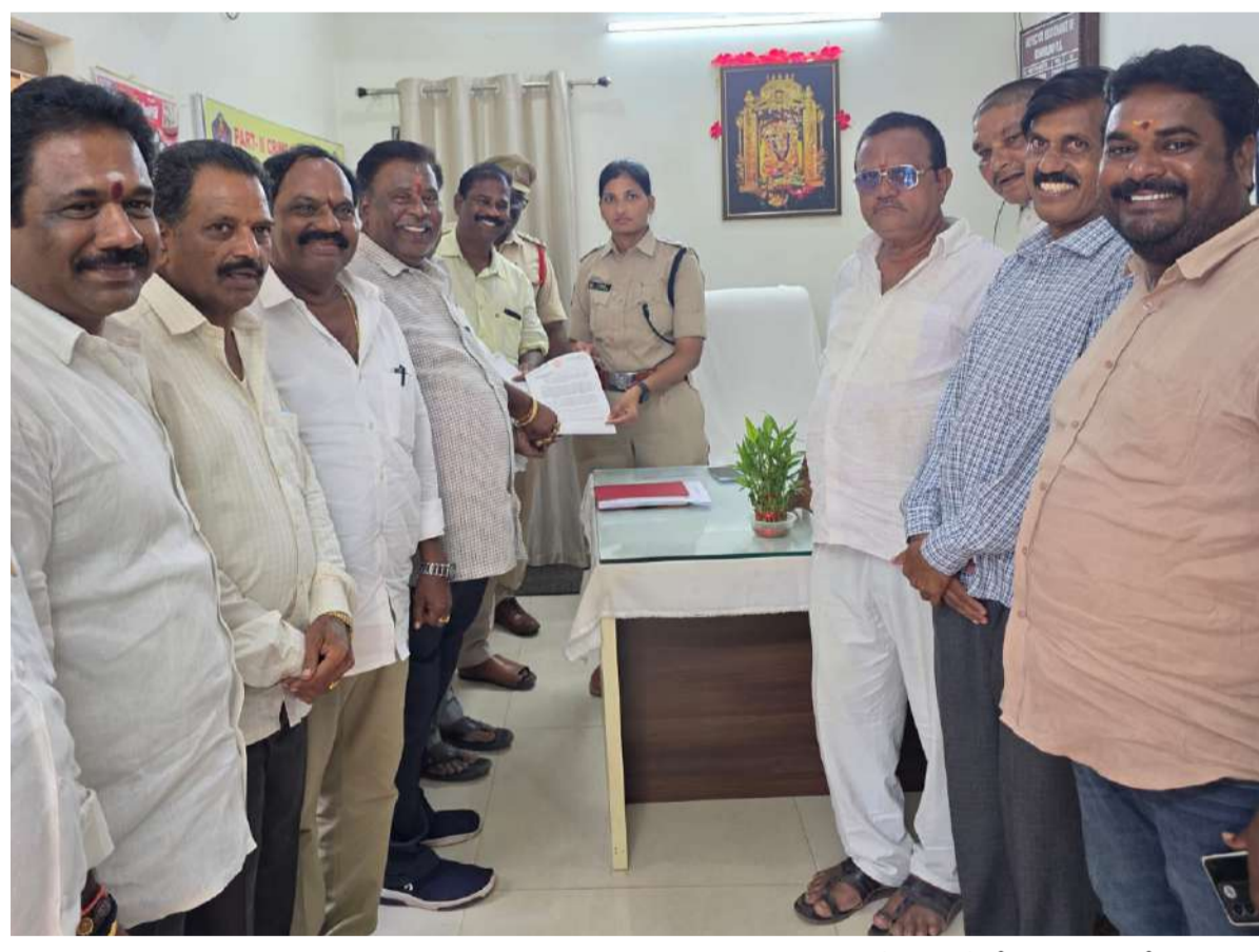
పాల్గొన్నారు. కోనసీమ ఎస్పీకి కాపు యువత ఫిర్యాదు సాక్షి మీడియాలో వచ్చిన తప్పుడు కథనాలపై