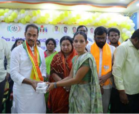
సంస్థ , మహిళా సంఘాల నాయకులు పెద్దఎత్తున పాల్గొన్నారు.

స్థాయిలో మహిళా సాధికారతను ప్రోత్సహించడం, పరిపాలనలో డిజిటల్ సాంకేతికతను భాగం చేయడమే కూటమి ప్రభుత్వ ప్రధాన లక్ష్యమని, సాంకేతికతను సద్వినియోగం చేసుకుని, గ్రామీణ పేదరిక నిర్మూలన సంస్థ సేవలను మరింత వేగవంతంగా, పారదర్శకంగా ప్రజలకు చేరువ చేయాలని సిబ్బందికి తెలియజేశారు. ఈ కార్యక్రమంలో డి ఆర్ డి ఏ, వెలుగు