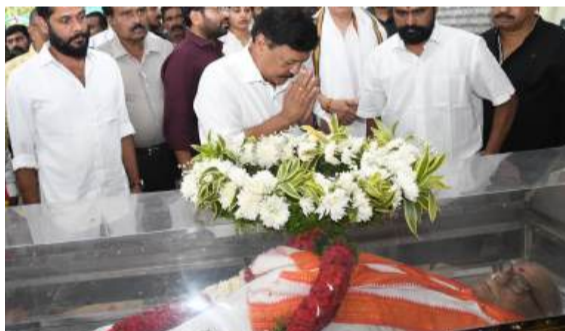
మాజీ ముఖ్యమంత్రి నాదెండ్ల భాస్కరరావు పార్శ్వదేహాన్ని మంత్రి కందుల దుర్గమ్ సందర్శించి నివాళులర్పించారు. మంత్రి నాదెండ్ల మనోహర్ కుటుంబాన్ని

పరామర్శించారు. అనంతరం అంత్యక్రియల్లో పాల్గొన్నారు. ఉమ్మడి ఆంధ్రప్రదేశ్ లో ప్రజాప్రతినిధిగా, ముఖ్యమంత్రిగా నాదెండ్ల భాస్కరరావు అందించిన సేవలను గుర్తుచేసుకున్నారు. ఆయన ఆత్మకు శాంతి చేకూరాలని, విషాదం నుంచి వారి కుటుంబసభ్యులు త్వరగా కోలుకోవాలని ఆకాంక్షించారు.