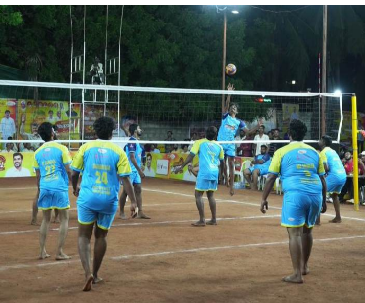
మంగళగిరి (చైతన్యరథం): తాడేపల్లి నారా లోకేష్ క్రీడా ప్రాంగణంలో కొనసాగుతున్న మంగళగిరి వాలీబాల్ లీగ్-4 టోర్నమెంట్ నాలుగవ రోజు ఫైనల్స్ ను తలపించేలా కొనసాగాయి. మొత్తం 12 జట్ల మధ్య 6 మ్యాచ్ లు ఉత్కంఠభరితంగా జరిగాయి. అవేంజెర్స్ నవులూరు, సురేష్ యూత్ మోరంపూడి జట్ల మధ్య జరిగిన మ్యాచ్ లో సురేష్ యూత్ మోరంపూడి జట్టు అద్భుత ప్రదర్శనతో విజయం సాధించింది. స్టార్ యూత్ నవులూరు మరియు సీకే హై స్కూల్ జట్ల మధ్య జరిగిన పోటీలో స్టార్