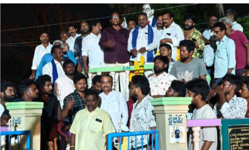
ఏకతాటిపైకి అంబేద్కర్ వాడులు