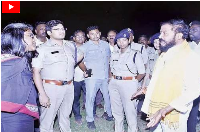
జనాభా నిర్వహణ (పాపులేషన్ మెయింటెనెన్స్)కు సంబంధించి సీఎం పర్యటన ఉంటుందని అధికార వర్గాలు తెలిపాయి. గోపన్నపాలెంలోని ప్రభుత్వ ఉన్నత పాఠశాల, అక్కడే ఉన్న అంగన్ వాడీ కేంద్రాన్ని సందర్శించారని చెబుతున్నారు. అనంతరం కేడర్ తో సమావేశమయ్యే

ఏలూరు(చైతన్యరథం): ముఖ్యమంత్రి చంద్రబాబు ఈనెల 25న దెందులూరు పర్యటనకు రానున్నారు. ఈ నేపథ్యంలో హెలిప్యాడ్ కు, సభ నిర్వహణకు అనువైన స్థలం ఎంపిక కోసం గోపన్నపాలెంలోని ప్రభుత్వ వ్యాయామ విద్యా కళాశాలను, ప్రభుత్వ ఉన్నత పాఠశాల ప్రాంగణాన్ని, గోపన్నపాలెంకు సమీపం లోని పెదవేగి మండలం లక్ష్మీపురం పరిధిలోని దెందులూరు మార్కెట్ యార్డు స్థలాన్ని కలెక్టర్ కె.వెల్డిసెల్వీ, ఎస్సీ కె.ప్రతాప్ శివకిశోర్ తో కలిసి దెందులూరు ఎమ్మెల్యే చింతమనేని ప్రభాకర్ బుధవారం రాత్రి పరిశీలించారు. వీటిలో హెలిప్యాడ్ తో పాటు ప్రజావేదికను ప్రభుత్వ వ్యాయామ కళాశాలలో నిర్వహించడానికి అనువుగా ఉంటుందని భావించి అధికారులు ఏర్పాట్లు చేస్తున్నారు.