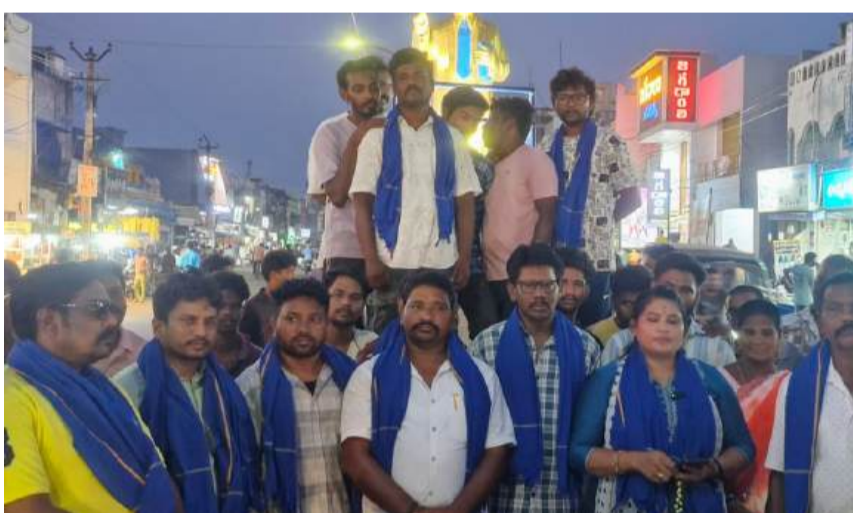
అనపర్తి అంబేద్కర్ విగ్రహం ఎదుట ఆందోళన