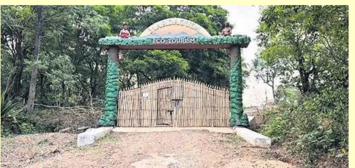
సెంటర్ నిర్మించనున్నారు. ఓపెన్ బటర్ ఫై గార్డెన్, ఆర్మిడేరియం, ఔషధ మొక్కల వనం, వాచ్ టవర్, సీతాకోకచిలుకలకు మకరంధం కోసం పుష్పజాతుల పెంపకం చేపట్టుతున్నారు. తూర్పుకనుమల్లోని జీవవైవిధ్యం గురించి ప్రజలకు అవగాహన కల్పించేందుకు ప్రత్యేక స్టడీ సెంటర్ ఏర్పాటు చేయనున్నారు. సెంద్రియ అటవీ ఉత్పత్తులను విక్రయించేందుకు దుకాణ సమదాయాలు ఏర్పాటు చేయనున్నారు.

ఎకో కాటేజీలతో పాటు నాన్ టింబర్ ఫారెస్ట్ ప్రొడ్యూస్ ప్రాసెసింగ్