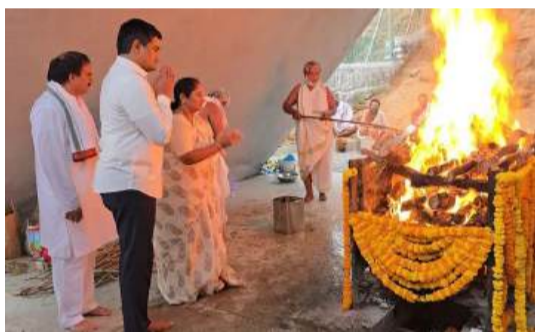
హైదరాబాద్ (చైతన్యరథం): సమైక్యం ప్రదేశ్ మాజీ ముఖ్య మంత్రి నాదెండ్ల భాస్కరరావు అంత్యక్రియలు గురువారం సాయంత్రం హైదరాబాద్ లో

ముగిసాయి. తెలంగాణ ప్రభుత్వ అధికారిక లాంఛనాలతో అంత్యక్రియలు నిర్వహించారు. రాష్ట్ర సూక్ష్మ, చిన్న, మధ్యతరహా పరిశ్రమలు, గ్రామీణ పేదరిక నిర్మూలన, ప్రవాసాంధ్రుల సాధికారత సంబంధాల శాఖ మంత్రి కొండపల్లి శ్రీనివాస్ నాదెండ్ల పార్శ్వదేహానికి నివాళులర్పించారు. మంత్రి నాదెండ్ల మనోహర్ ను పరామర్శించారు. ఈ సందర్భంగా కొండపల్లి మాట్లాడుతూ సీనియర్ రాజకీయ వేత్తను కోల్పోవడం మన దుర్మఘటకమని వ్యాఖ్యానించారు.