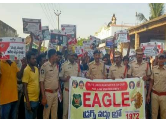
సింగరాయకొండ (చైతన్యరథం): ప్రకాశం జిల్లా సింగరాయకొండ