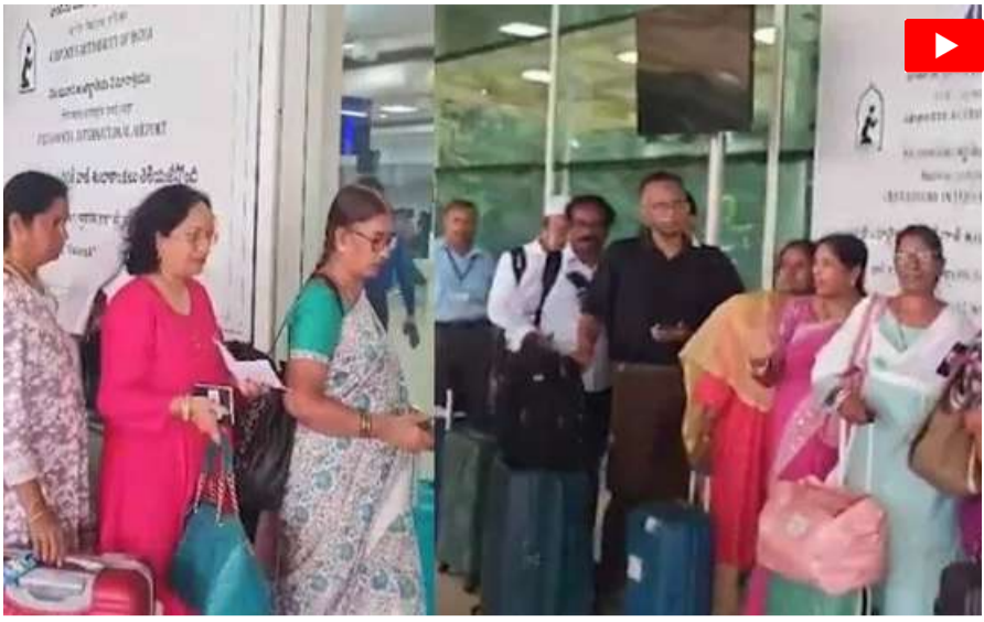
విద్యా వ్యవస్థపై అధ్యయనం కోసం