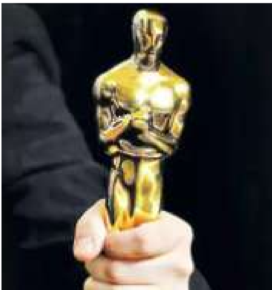
ఆయన ఆస్కార్ విగ్రహాన్ని విమానం లోపలికి అనుమతించక పోవడంతో దాన్ని ఒక డబ్బాలో పెట్టి కార్గోలో పంపాల్సి వచ్చింది.