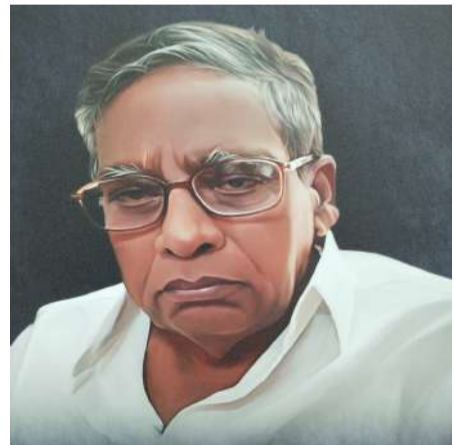
గుడ్లపల్లెరు (చైతన్యరథం): ఉమ్మడి కృష్ణా జిల్లా తెలుగుదేశం పార్టీ