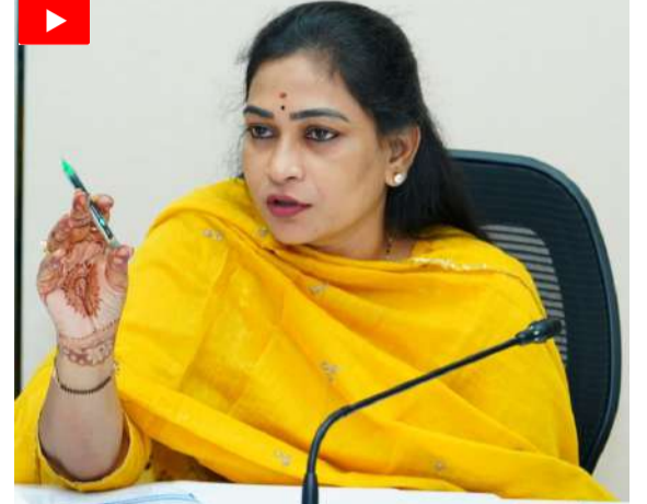
ఇవ్వా లని సూచించారు. అగ్నిమాపక అత్యవసర సేవలను 112 సేవల తో సమన్వయం చేయాలని ఆదేశాలు జారీ చేశారు.

లైసెన్స్ పొడిగింపులకు ఫైర్ సేఫ్టీ సర్టిఫికెట్లు తప్పనిసరి చేయాలని సూచించారు. అడవిలో అగ్నిప్రమాదాల నియంత్రణలో డ్రోన్ల వినియోగంపై దృష్టిసారించాలని ఆదేశించారు. వ్యర్థాలపై సరైన వర్గీకరణ లేకపోవడంతో అగ్నిప్రమాదాలు జరుగుతున్నాయని ఆం దోశన వ్యక్తం చేశారు. పాఠశాలలు, ఆస్పత్రులు, అపార్ట్ మెంట్లలో ఫైర్ సేఫ్టీ అవగాహన కార్యక్రమాలు నిర్వహించాలని దిశానిర్దేశం చేశారు. 'అపద మిత్ర' తరహాలో యువతకు స్వచ్ఛంద సేవా శిక్షణను విస్తరించాలని సూచించారు. సింగపూర్, స్విట్జర్లాండ్ విపత్తు నిర్వహణ విధానాలపై అధ్యయనం చేయాలని మార్గనిర్దేశం చేశారు. ఫిట్నెస్ గేమ్స్, చండీగఢ్ నమూనాలను పరిశీలించి నివేదిక