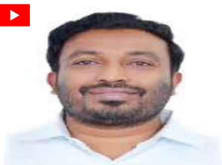
రైల్వే ప్రయాణికులు సద్వినియోగం చేసుకోవాలని ఆయన కోరారు.

రైలుగా నడిచిన ఈ సర్వీసు.. ఒకపై రెగ్యులర్గా నడుస్తుందన్నారు. ప్రయాణికుల అవసరాలను దృష్టిలో పెట్టుకుని మరిన్ని నూతన సర్వీసులను ప్రారంభించేలా చర్యలు తీసుకుంటామన్నారు. త్వరలో కాకినాడ నుంచి రాజస్థాన్లోని జైపూర్, యూపీలోని వారణాసి, దిల్లీకి కూడా ప్రత్యేక రైలు వేయనున్నట్లు ఎంపీ వెల్లడించారు. షిరిడీ వెళ్లే వారికోసం సీట్ల సంఖ్య పెంచనున్నట్లు తెలిపారు. ఈ