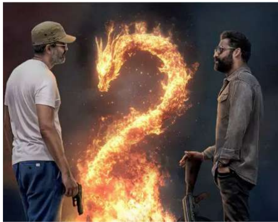
ఎస్టిఆర్ అభిమానులకు సంతోషకరమైన వార్త వచ్చింది. దర్శకుడు