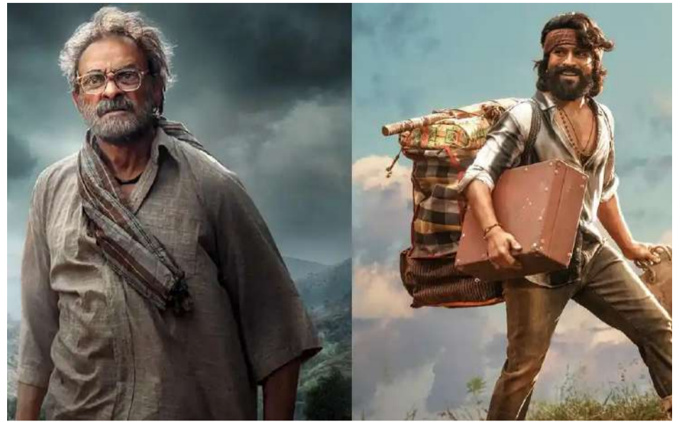
గతంలో 'రంగస్థలం'లో విలన్గా నటించిన జగపతిబాబు, ఈసారి పాజిటివ్

ఈసారి విలన్ కాదు -రామ్చరణ్ కు తండ్రి పాత్రలో కనిపించనున్నారు. ఫస్ట్ హాఫ్లో కథను నడిపిస్తూ, ఇంటర్వెల్ సమయంలో హీరోకు ఓ లక్ష్యాన్ని నిర్దేశించే ఎమోషనల్ పాత్రగా అప్పలసూరి సాగుతుందని సమాచారం.