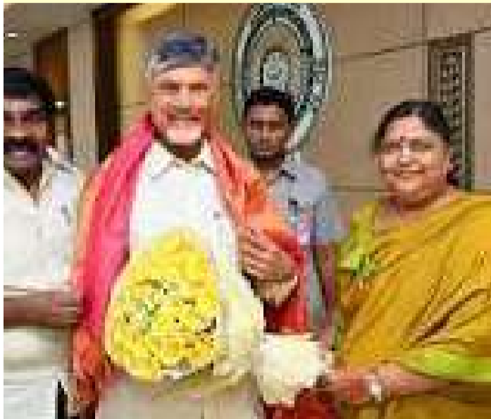
తిరుపతి (చైతన్యరథం): చట్టసభల్లో మహిళలకు 33 శాతం రిజర్వేషన్ కల్పించే మహిళా రిజర్వేషన్ బిల్లు ఇంకా పూర్తిస్థాయిలో

మనసున్న అభినేతలు సీఎం చంద్రబాబు, మంత్రి నారా లోకేశ్, మహిళా రిజర్వేషన్ హామీపై కేంద్రమాజీమంత్రి పనబాక లక్ష్మి