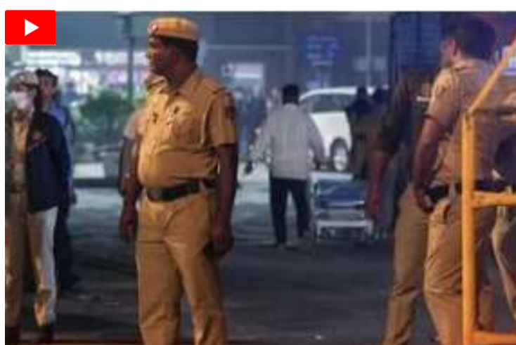
గతేడాది ఎర్రకోట వద్ద జరిగిన పేలుడులో 15 మంది మరణించిన విషయం తెలిసింది. ఈ కేసులో నిందితులందరూ ఉన్నత విద్యావంతులు కావడంతో పోలీసులు వైట్ కాలర్ ఉగ్రవాదంపై కూడా గట్టి నిఘా పెట్టారు.

కూడా వారు టార్గెట్ చేసే యోచనలో ఉన్నారని అన్నారు. ఉగ్రమూకపై గత కొంతకాలంగా నిఘా పెట్టి తాజాగా అదుపులోకి తీసుకున్నామని అన్నారు. ఈ కుట్రలో పాక్ పాత్ర ఏ మేరకు ఉంది అనే అంశంపై దర్యాప్తు చేస్తున్నామని అన్నారు. నిధులు ఎవరు ఇస్తున్నారో? ఈ మూతాకు విదేశీ హ్యాండ్లర్లు ఎవరో? తెలుసుకునేందుకు ప్రయత్నిస్తున్నామని చెప్పారు. ఢిల్లీలో ఉగ్రదాడులు జరిగితే అవకాశం ఉందన్న సమాచారం నడుమ అక్కడి పోలీసులు అప్రమత్తంగా ఉంటున్నారు. నిఘా వర్గాల, కేంద్ర పారామిలిటరీ దళాలతో సమన్వయంతో అన్ని జిల్లా యూనిట్స్ హైఅలర్ట్ లో ఉంటున్నాయి. ఇక