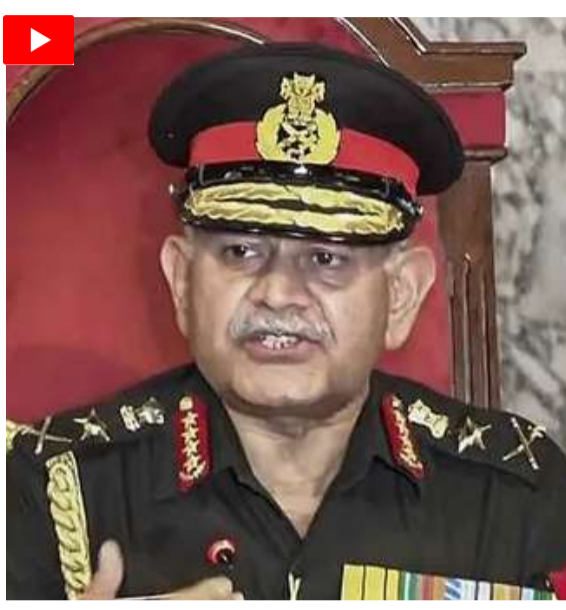
మోహరింపులు, ప్రొటెక్షన్ చర్యలపై మిలటరీ వ్యూహకర్తలు అత్యంత అప్రతంగా ఉండాలని

న్యూఢిల్లీ: పాకిస్తాన్ కు ఆర్మీ చీఫ్ జనరల్ ఉపేంద్ర ద్వితీయ గట్టి హెచ్చరిక చేశారు. అవసరమైతే ఆపరేషన్ సిందూర్ 2.0కు భారత సైనిక బలగాలు సర్వ సన్నద్ధంగా ఉన్నాయని చెప్పారు. భూమి, ఆకాశం, సముద్రంలో అత్యాధునిక రీతుల్లో పోరాటానికి త్రివిధ దళాలు సామర్థ్యం పెంచుకుంటున్నట్లు తెలిపారు. పుణెలో శనివారంనాడు జరిగిన నేషనల్ డిఫెన్స్ అకాడమీ 150వ పాసింగ్ ఔట్ పరేడ్ అనంతరం మీడియాతో ఆయన మాట్లాడారు. శాంతి తాత్కాలికమేనని, అవసరమైతే ఆపరేషన్ సిందూర్ సెకెండ్ ఫేజ్ కు కూడా త్రివిధ దళాలు పట్టుదలగా సర్వసన్నద్ధమవుతున్నాయని అన్నారు. భవిష్యత్తులో జరుగబోయే యుద్ధాలు కేవలం భూమి, సముద్రం, ఆకాశానికే పరిమితం కావని ద్వితీయ అన్నారు. స్పేస్, సైబర్, కాగ్నీటివ్ డొమెయిన్లలోనూ యుద్ధప్రభావం ఉంటుందన్నారు.