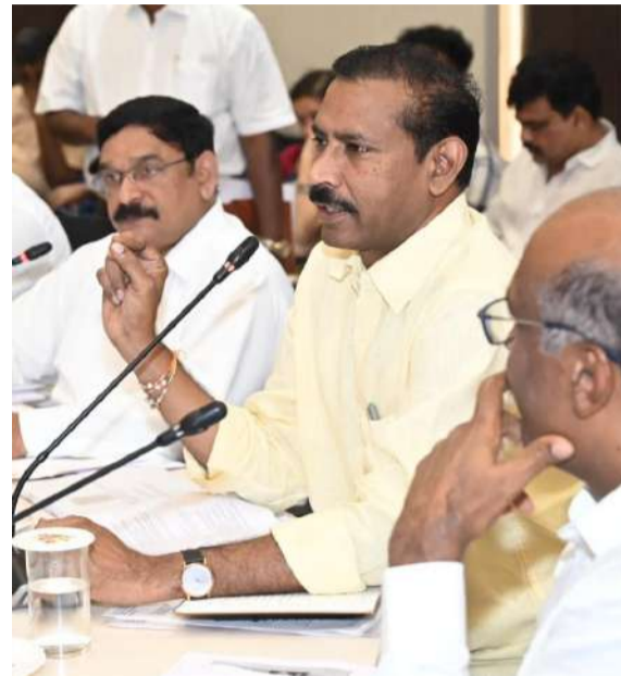
కలెక్టర్ సానుకూలంగా స్పందించి తగిన చర్యలు చేపడతామని హామీ ఇచ్చినట్లు తెలిపారు.

గాజువాక నియోజకవర్గ ప్రజలు ఎదుర్కొంటున్న సమస్యలను ప్రతి వేదికపై ప్రస్తావిస్తూ వాటి పరిష్కారానికి నిరంతరం కృషి చేస్తున్నామని పేర్కొన్నారు. అర్జులైన ప్రతి ఒక్కరికీ ప్రభుత్వ పథకాల ప్రయోజనాలు అందేలా, పెండింగ్ సమస్యలకు శాశ్వత పరిష్కారం లభించేలా అధికార యంత్రాంగంతో సమన్వయం కొనసాగిస్తామని స్పష్టం చేశారు. సమావేశంలో విశాఖపట్నం జిల్లా ఎమ్మెల్యేలు, జిల్లా కలెక్టర్, వివిధ శాఖల అధికారులు పాల్గొన్నారు.