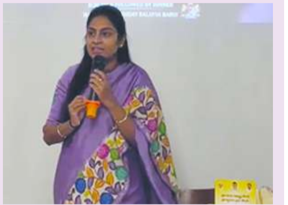
జన్మదిన వేడుకలను సింగపూర్లో అత్యంత ఘనంగా నిర్వహించడం మా అదృష్టంగా భావిస్తున్నాము. బాలయ్య బాబు పట్ల ఉన్న అభిమానాన్ని ఇలాగే కొనసాగిస్తాం” అని తెలిపారు. జై బాలయ్య... జై జై బాలయ్య అంటూ పెద్ద ఎత్తున నినాదాలు చేశారు.