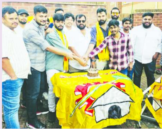
బాలకృష్ణ పుట్టినరోజును ఆయన అభిమానులు వేడుకగా జరిపారు. కేక్ కట్ చేసి సంబరాలు జరుపుకున్నారు. తమ అభిమాన నటుడికి జన్మదిన శుభాకాంక్షలు తెలిపారు.

లెస్టర్, కోవెంట్రీ (యూకే): ప్రముఖ సినీ నటుడు, హిందూపురం ఎమ్మెల్యే నందమూరి బాలకృష్ణ జన్మదిన వేడుకలను యునైటెడ్ కింగ్డమ్లోని లెస్టర్ నగరంలో ఆయన అభిమానులు ఘనంగా నిర్వహించారు. వివిధ నగరాల నుంచి వచ్చిన వందలాది మంది అభిమానులు కేక్ కట్ చేసి బాలకృష్ణ తమ అభిమానాన్ని చాటుకున్నారు. కార్లతో ర్యాలీ నిర్వహించారు. “అఖండ తాండవం” నృత్య ప్రదర్శనతో పాటు శాస్త్రీయ నృత్య ప్రదర్శనలు ప్రత్యేక ఆకర్షణగా నిలిచాయి. బాలకృష్ణకు అంకితంగా రూపొందించిన ప్రత్యేక గీతాన్ని విడుదల చేశారు. బాలకృష్ణ జన్మదినాన్ని పురస్కరించుకుని ప్రతి సంవత్సరం ఇలాంటి కార్యక్రమాలు నిర్వహిస్తామని నిర్వాహకులు తెలిపారు. మరోవైపు కోవెంట్రీ నగరంలోనూ నటసింహం