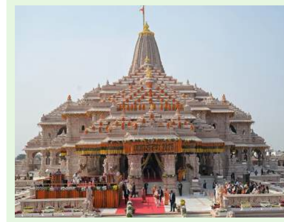
అయోధ్య: అయోధ్య రామమందిరాన్ని సందర్శించే భక్తుల సంఖ్య రోజురోజుకీ పెరుగుతుండటంతో విరాళాలు కూడా భారీగా

ఒకేరోజు రాత్రి దొంగలపాలయ్యాయి. పోలీసులకు ఫిర్యాదు చేసినా.. పరిస్థితిలో మార్పు లేకపోవడంతో తమకు మరో మార్గం తోచలేదని రైతులు అంటున్నారు. అందుకే నేరుగా దొంగలనే వేడుకుంటున్నామన్నారు.