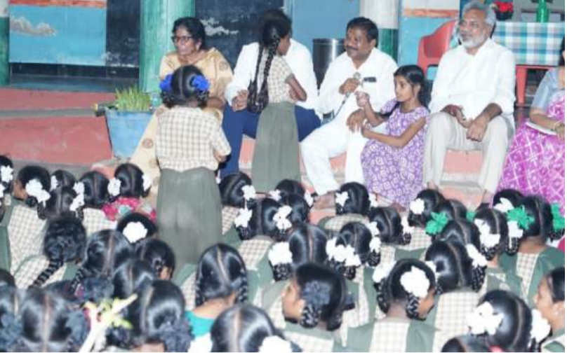
కృషిని అభినందించారు. ఎంపికైన దివ్యాంగు లకు ఆఫర్ లెటర్లను పంపిణీ చేశారు.

కాకినాడ జిల్లా పర్యటనలో భాగంగా మంత్రి డోలా శ్రీ బాల వీరాంజనేయస్వామి బుధవారం సాయంత్రం కలెక్టరేట్ వివేకా నంద సమావేశ హాలులో సాంఘిక సంక్షేమం, దివ్యాంగులు, వృద్ధుల సంక్షేమం, స్వర్ణ గ్రామ,వార్డు శాఖల అధికారులతో సమావేశం నిర్వహించారు. ఆయా శాఖల ద్వారా జిల్లాలో అమలవుతున్న కార్యక్రమాల ప్రగతిని సమీక్షించి సూచనలు, ఆదేశాలు జారీ చేశారు. గతంలో ఎన్నడూ లేని స్థాయిలో సంక్షేమ హాస్టళ్ల రిపేర్లకు రూ.143 కోట్లు, కొత్త నిర్మాణాలకు 104 కోట్లు, హాస్టళ్లలో మరుగుదొడ్ల నిర్మాణానికి 68 కోట్లు మంజూరు చేసిందని, అదనంగా మరో రూ.200 కోట్లు మంజూరు చేయనుందని తెలియజేశారు. రాష్ట్రంలో 390 బ్యాంక్ లాగ్ పోస్టుల భర్తీ చేపట్టామని వివరించారు. కాకినాడ జిల్లాలో దివ్యాంగుల కోసం ప్రత్యేక జాబ్ మేళా నిర్వహించి 41 మందికి ఉద్యోగావకాశాలను కల్పించిన అధికారుల