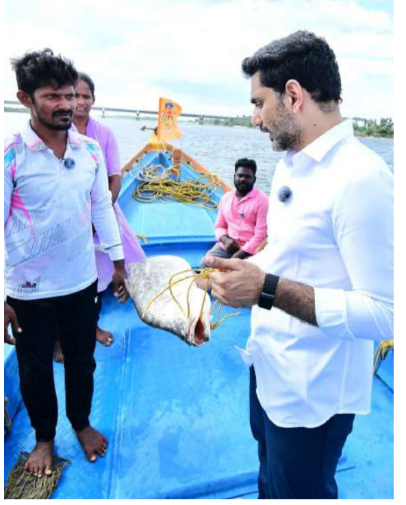
ఆయిల్ సబ్సిడీ పెంచాలి

చిన్న పడవల కొనుగోలుకు ఒక్కో పడవకు రూ.2.5 లక్షలు, పెద్ద పడవకు రూ.7.5 లక్షల