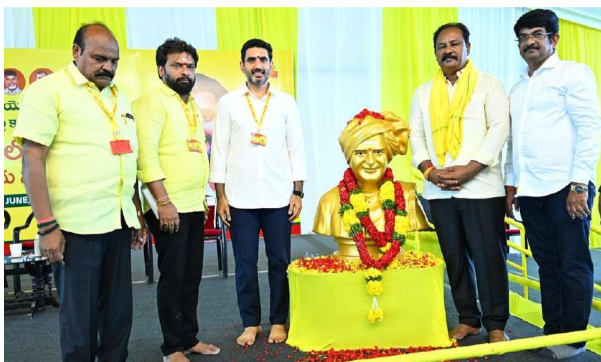
కార్యకర్త అభినేత నినాదానికి కట్టుబడి ఉన్నాం

కార్యకర్త అభినేత అనే నినాదానికి కట్టుబడి దేశంలో ఏ పార్టీ చేయని విధంగా కార్యకర్తల సంక్షేమం అమలు చేస్తున్నాం. చనిపోయిన కార్యకర్తలకు రిలక్షుల సాయం అందిస్తున్నాం. తప్పుడు కేసులన్నీ తీసివేసే బాధ్యత నేను తీసుకున్నాను. కార్యకర్తల సంక్షేమం కోసం 160కోట్లు ఖర్చుపెట్టిన ఏకైక పార్టీ తెలుగు దేశం. కార్యకర్తలు సొంత కాళ్ళపై నిలబడాలన్నదే మా ధ్యేయం. మిమ్మల్ని నిలబెట్టే బాధ్యత తెలుగుదేశం పార్టీది. క్లస్టర్ ఇన్చార్జి, యూనిట్ ఇన్చార్జిల శిక్షణా తరగతుల సందర్భంగా వైద్య పరీక్షలు నిర్వహిస్తే, 75 శాతం మందికి షుగర్, హైపర్ టెన్షన్ ఉన్నాయి. క్లస్టర్, యూనిట్, బూత్ నాయకులందరికీ పరీక్షలు చేయమని సీఎం చెప్పారు, ఆ కార్యక్రమం కూడా చేపడతాం. మీ ఆరోగ్యాన్ని మెరుగుపర్చే బాధ్యత తీసుకుంటాం. యోగాంధ్రలో చంద్రబాబు ఎంతో చురుగ్గా పాల్గొన్నారు. ఆయన స్పీడ్ అండుకోవడం కష్టం. ఆయన ప్రతిరోజూ యోగా చేస్తారు. తెలుగు దేశం పార్టీ కుటుంబం లాంటిది, చిన్నచిన్న సమస్యలు ఉంటాయి, కూర్చుని మాట్లాడుకుందాం. పార్టీలో సంస్కరణల కోసం నేను ఎంతో పోరాడాను. సమస్య ఎదురైతే పరిష్కారమయ్యేవరకు వందపార్లు పోరాడ దాం. కష్టపడిన కార్యకర్తలను గుర్తించేందుకు ఇప్పుడు మై టీడీపీ యాప్ తెచ్చాం. మీరు చేస్తున్న కష్టం ఈ యాప్ ద్వారా తెలియజేయండి, యాక్టివ్ గా ఉండండి. గ్రామస్థాయి నాయకుణ్ణి పొలిట్ బ్యూరోలో కూర్చో బెట్టేవరకూ పోరాడాను. గతంలో ఎన్నడూ లేనివిధంగా ఈసారి క్లస్టర్ ఇన్చార్జి, మండల పార్టీ అధ్యక్షుడు పొలిట్ బ్యూరో సభ్యులు అయ్యారు. గ్రామస్థాయి నుంచి మార్పు రావాలన్నది నా లక్ష్యం. పార్టీ మనది, దీనిని కాపాడుకోవడం మన బాధ్యత. కలసికట్టుగా ముందుకు తీసుకెళ్ళాలి.