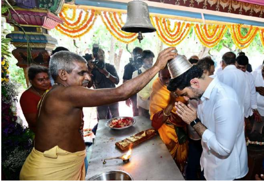
భవనాన్ని ప్రారంభించిన అనంతరం గ్రామంలోని శ్రీ గంగా భ్రమరాంబ సమేత శ్రీ మల్లేశ్వరస్వామి