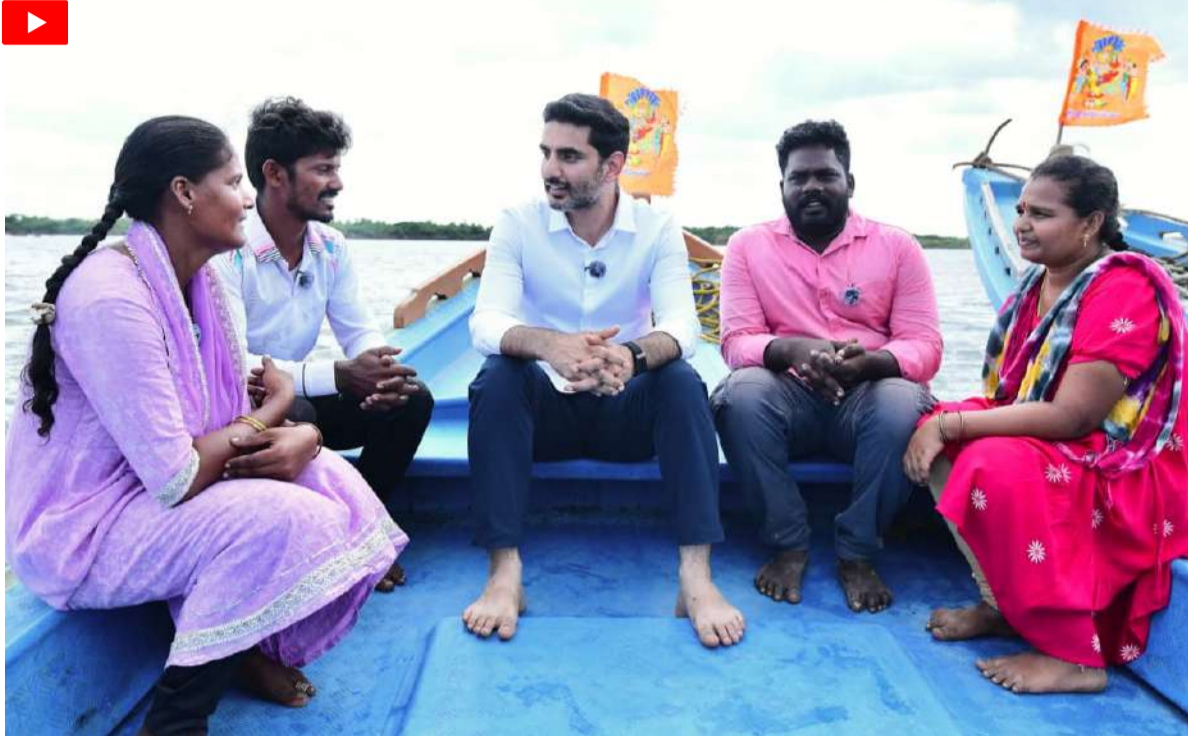
పడవ కొనుగోలుకు రూ.2.50 లక్షలు

పులిగడ్డలోని మత్స్యకార కుటుంబాలతో కలిసి వేటిపాయలో మంత్రి నారా లోకేశ్ స్వయంగా పడవలో ప్రయాణించారు. మత్స్యకారుల జీవన స్థితిగతులను మంత్రి ప్రత్యక్షంగా పరిశీలించారు. బోట్లతయారీ, వినియోగం, చేపల వేట, అమ్మకం, ఆదాయం, కుటుంబ స్థితిగతులు, సమస్యలు అడిగి తెలుసుకున్నారు. చేపల వేట నిషేధ సమయంలో ప్రజాప్రభుత్వం అందిస్తున్న మత్స్యకార భరోసాపైనా మంత్రి ఆరా తీశారు.