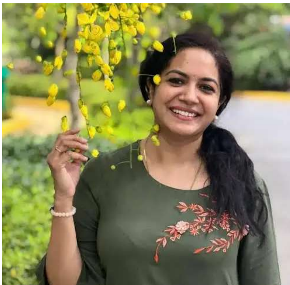
సినిమా ఇండస్ట్రీ మహిళలకు ఏమాత్రం సేఫ్ కాదని ప్రముఖ సింగర్ సునీత సంచలన వ్యాఖ్యలు చేశారు. ఓ ఇంటర్వ్యూలో మాట్లాడిన సునీత,