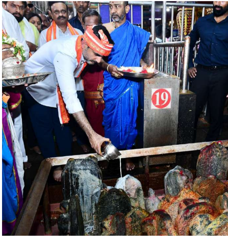
మోపిదేవి (చైతన్య రథం): కృష్ణా జిల్లా అవనిగడ్ల నియోజకవర్గం మోపిదేవిలోని శ్రీ సుబ్రహ్మణ్యేశ్వర స్వామి దేవాలయాన్ని విద్య, ఐటీ మంత్రి నారా లోకేష్ సందర్శించారు. ముందుగా ఆలయ ప్రాంగణానికి చేరుకున్న మంత్రి లోకేష్ కు వేద పండితులు, ఆలయ అధికారులు పూర్ణకుంభంతో ఘనస్వాగతం పలికారు. అనంతరం నాగపుట్ల వర్ణ పాలుపోసి శ్రీ వల్లీ దేవసేన సమేత శ్రీ సుబ్రహ్మణ్యేశ్వర స్వామివారిని