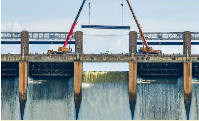
తుంగభద్ర డ్యామ్ 19వ గేట్ తెగిపోయిన దృశ్యం

తుంగభద్ర డ్యామ్ నిర్మించి దాదాపు 70 ఏళ్లు దాటుతున్నా, గతంలో ఏ ప్రభుత్వమూ కూడా ఈ డ్యామ్ గేట్ల శాశ్వత భద్రత లేదా మార్పిడి గురించి ఆలోచించలేదు. నేడు తుంగభద్ర డ్యామ్ కు ఉన్న మొత్తం 33 పాత క్రెస్ట్ గేట్లను పూర్తిగా తొలగించి, వాటి స్థానంలో అత్యాధునిక నూతన గేట్లను ఏర్పాటు చేసే కార్యక్రమంలో ఆంధ్రప్రదేశ్ వాటాగా రూ.54.42 కోట్ల నిధులను ముఖ్యమంత్రి తక్షణమే విడుదల చేసి, ఖరీఫ్ సీజన్ నాటికి గేట్ల మార్పిడి పూర్తయ్యేలా కృషి చేశారు.