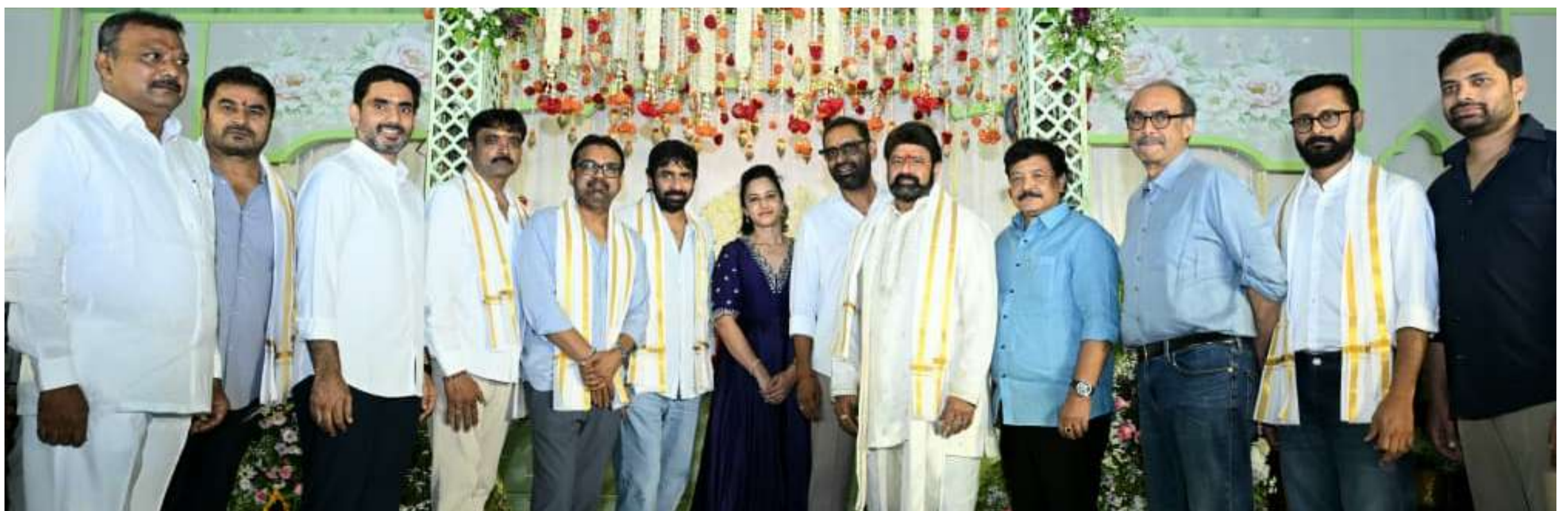
ప్రోత్సహించే లక్ష్యంతో పనిచేస్తున్నాం. సినీమాతో