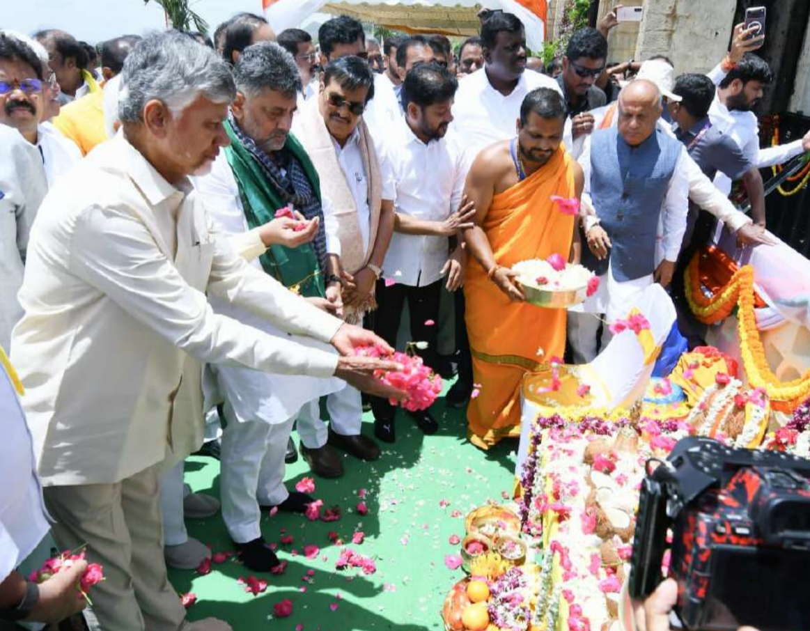
ప్రాజెక్టు, జలాల వినియోగంపై సమావేశమయ్యారు. మూడు రాష్ట్రాల ప్రయోజనాలపై నలుగురు నేతలు విస్తృతంగా చర్చించారు.

హోస్పేట/కర్ణాటక(చైతన్యరథం): కేంద్ర జలశక్తి మంత్రి సీఆర్ పాటిల్ నేతృత్వంలో ఆంధ్రప్రదేశ్, కర్ణాటక, తెలంగాణ రాష్ట్రాల ముఖ్యమంత్రులు కలిసి తుంగ భద్ర ప్రాంత రైతుల ప్రయోజనాలపై చర్చించడం చారిత్రాత్మక ఘట్టమని ముఖ్యమంత్రి చంద్రబాబు నాయుడు పేర్కొన్నారు. రాష్ట్రాలు వేరైనా దేశంగా మన మంతా ఒక్కటేనని, రైతుల సంక్షేమం కోసం కలిసి పనిచేయాల్సిన అవసరం ఉందని అన్నారు. మూడు రాష్ట్రాల రైతులకు సాగు నీటిని, ప్రజలకు తాగునీటిని అందిస్తున్న తుంగభద్ర డ్యామ్ అభివృద్ధిలో కీలకపాత్ర పోషిస్తోందని చెప్పారు. 2024 ఆగస్టులో తుంగభద్ర ప్రాజెక్టులో 19వ నెంబరు గేటు కొట్టుకు పోవటంతో తక్షణం స్పందించి స్టాప్ లాక్ గేట్ అమర్చామని తెలిపారు. ప్రాజెక్టు మరమ్మతులో భాగంగా రూ. 51కోట్ల వ్యయంతో మొత్తం 33 కొత్త గేట్లను ఏపీ, కర్ణాటక రాష్ట్ర ప్రభుత్వాలు సంయుక్తంగా వీటిని ఏర్పాటు చేసినట్లు వివరించారు. ఈ గేట్ల ప్రారంభోత్సవంలో ఏపీ సీఎం చంద్రబాబు, తెలంగాణ సీఎం రేవంత్ రెడ్డి, కర్ణాటక సీఎం డీకే శివకుమార్, కేంద్రమంత్రి సీఆర్ పాటిల్ పాల్గొన్నారు. తుంగభద్ర డ్యామ్ లోని సీఎం చంద్రబాబు 19వ నెంబరు గేటు, కర్ణాటక ముఖ్యమంత్రి 18వ గేటును, కేంద్ర మంత్రి సీఆర్ పాటిల్ 17వ గేటును, 20గేటును తెలంగాణ ముఖ్యమంత్రి రేవంత్ రెడ్డి ప్రారంభించారు. ఈ ప్రారంభోత్సవానికి ముందు కేంద్ర జలశక్తి మంత్రి సీఆర్ పాటిల్ నేతృత్వంలో మూడు రాష్ట్రాల ముఖ్య మంత్రులు తుంగభద్ర