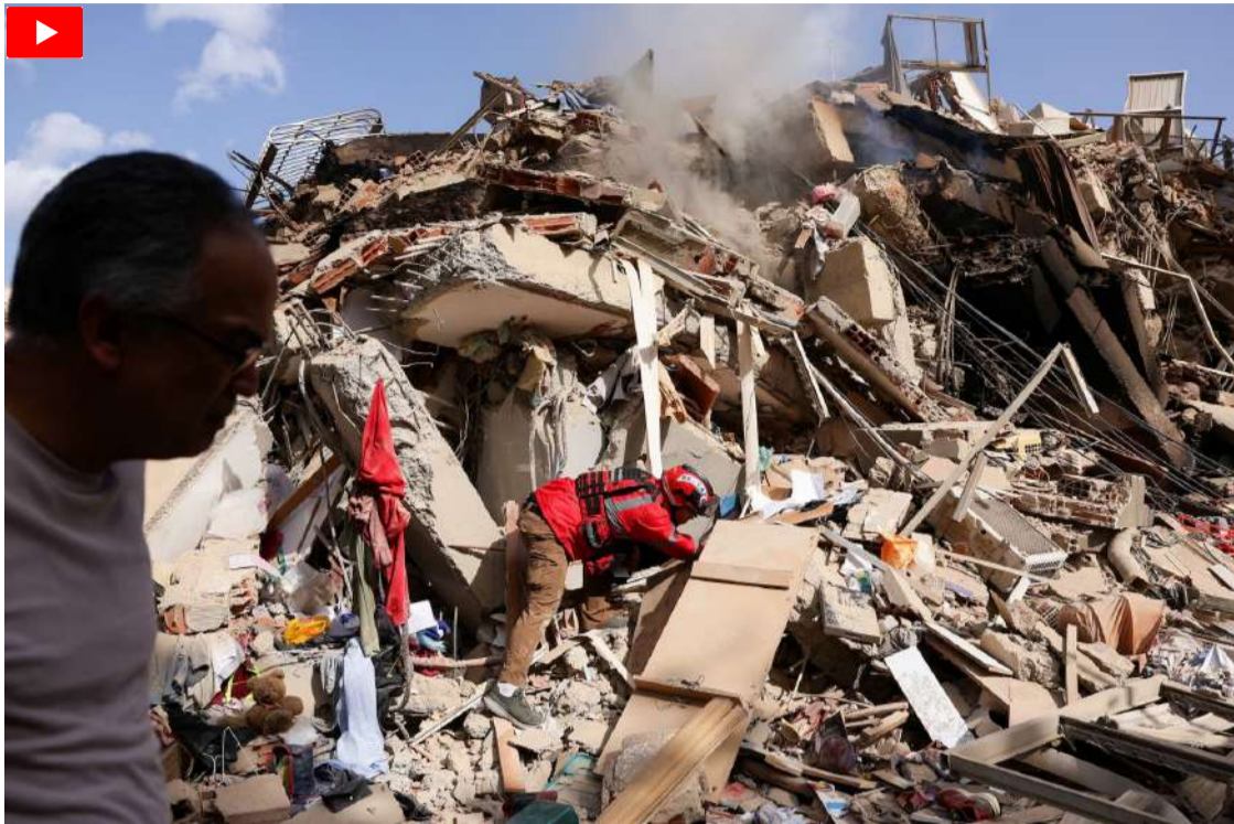
చిక్కుకున్నట్లు సమాచారం అందుతోంది.

లా గువైరాలోని మకుటో ప్రాంతంలో ఎంతో ప్రసిద్ధి చెందిన 'హోటల్ ఎడెక్స్' పర్యాటకులను విశేషంగా ఆకర్షిస్తుంటుంది. ఎయిర్పోర్టుకు సమీపంలో ఉండే ఈ 10 అంతస్తుల భవనం ఎప్పుడూ వేడుకలు సమావేశాలతో కోలాహలంగా ఉండేది. అయితే తాజాగా సంభవించిన భూకంపం ధాటికి ఈ భవనం పేకమేడలా కూలిపోయింది. కేవలం హోటల్ బేస్మెంట్ మాత్రమే మిగిలి మిగతా భాగమంతా గుర్తుపట్టలేని విధంగా ధ్వంసమైంది. దీనికి సంబంధించిన దృశ్యాలు ప్రస్తుతం సామాజిక మాధ్యమాల్లో వైరల్ గా మారాయి. భూకంపం సమయంలో ఈ హోటల్లో ఎంతమంది ఉన్నారనేది ఇంకా తెలియరాలేదు. కాగా వెనెజువెలా బాక్సింగ్ స్టార్ కుటుంబ సభ్యులు ఈ హోటల్ శిథిలాల కింద