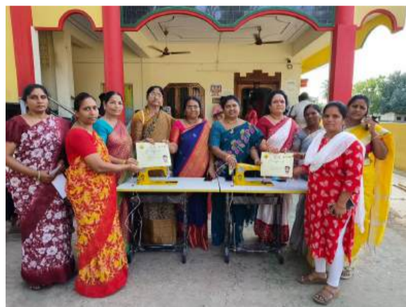
మంగళగిరి (చైతన్యరథం): మంగళగిరి నియోజకవర్గంలో స్త్రీ శక్తి కార్యక్రమంలో భాగంగా మంత్రి నారా లోకేశ్ సొంత నిధులతో నిర్వహిస్తున్న ఉచిత కుట్టు శిక్షణ కార్యక్రమం 80వ బ్యాచ్ విజయవంతంగా పూర్తయింది, ఈ సందర్భంగా మంగళగిరి టౌన్ మరియు మంగళగిరి రూరల్ ప్రాంతాలకు చెందిన