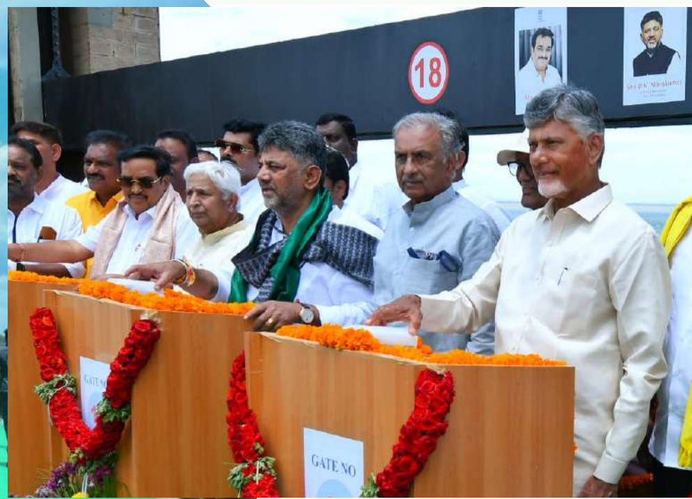
నీటి వనరులు పొందుపుగా వినియోగించాలి

ఎల్.ఎన్ ప్రభుత్వంతో జలాశయాలుకు నీటి ప్రవాహాలు తగ్గుతున్న నేపథ్యంలో నీటి వనరులను పొందుపుగా వినియోగించి చుకోవాల్సిన అవసరం ఉందని తెలిపారు. ముందుగా రాష్ట్రాల అంతర్గతంగా నదుల అనుసంధానం చేపట్టి ఆ తర్వాత రాష్ట్రాల మధ్య అనుసంధానానికి అడుగులు వేయాలని సూచించారు. రైతుల ప్రయోజనాల పరిరక్షణ అన్ని ప్రభుత్వాల ఉమ్మడి లక్ష్యమని స్పష్టం చేశారు. దక్షిణాది రాష్ట్రాల మధ్య జరిగిన ఈ సమావేశం చరిత్రలో నిలిచిపోతుందని పేర్కొన్నారు. అంతా కలిసి రైతుల ప్రయోజనాలను కాపాడుకుందామని పిలుపునిచ్చారు. ఆధునిక దేవాలయాలైన ప్రాజెక్టులను పరిరక్షించుకుంటే దేశాభివృద్ధికి అవి కీలకం అవుతాయని అన్నారు. ఈ సమావేశానికి ఏపీ మంత్రులు పయ్యపుల కేశవ్, నిమ్మల రామానాయుడు, తెలంగాణ మంత్రులు ఉత్తమ్ కుమార్ రెడ్డి సహా మూడు రాష్ట్రాల స్థానిక ప్రజాప్రతినిధులు హాజరయ్యారు.