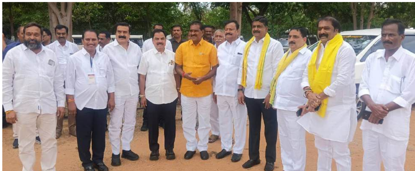
కర్ణాటకలోని హెబెల్ సమీపంలోని తుంగభద్ర డ్యామ్ నూతన గేట్లు ప్రారంభోత్సవానికి విచ్చేస్తున్న ఆంధ్రప్రదేశ్ ముఖ్యమంత్రి నారా చంద్రబాబునాయుడుకు స్వాగతం పలకడానికి హెలిప్యాడ్ వద్ద వేచి ఉన్న హిందూపురం పార్లమెంటు సభ్యుడు బీకే పార్థసారథి, భారీ నీటిపారుదల శాఖ మంత్రి నిమ్మల రామానాయుడు, ఉమ్మడి అనంతపురం జిల్లా ఎమ్మెల్యే ఇతర ప్రజాప్రతినిధులు