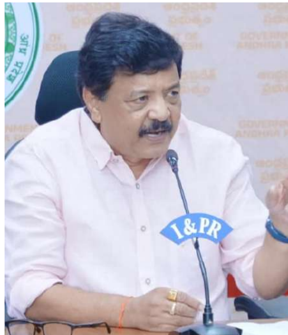
ఆయన నిరంతర తపన. రూపాయి అవినీతి లేకుండా ప్రభుత్వ నిధులు ప్రతి పైసా నేరుగా ప్రజలకే చేరాలనేది ఆయన వైజం. కుర్చీ కోసం ఆరాటం మీది.. ప్రజా సేవ కోసం పోరాటం మా నాయకుడు

అమరావతి(చైతన్యరథం): ఐదేళ్ల పాటు అధికార దాహంతో రాష్ట్రాన్ని దోచుకున్న వైసీపీ నేతలకు, పదవులు ఉన్నా లేకపోయి నా నిత్యం ప్రజల పక్షాన నిలబడే పవన్ కళ్యాణ్ నైతికతను విమ ర్శించే స్థాయి లేదని మంత్రి కందుల దుర్గేష్ శనివారం ఒక ప్రకటనలో మండిపడ్డారు. కూటమి ప్రభుత్వంలో డిప్యూటీ సీఎంగా పవన్ కళ్యాణ్ సాధిస్తున్న అద్భుత విజయాలు, ప్రజాదరణను చూసి వైసీపీలోని కాపు నేతలు తట్టుకోలేకపోతున్నారని విమర్శించారు. పల్లె పండుగ ద్వారా గ్రామాలు, ఏజెన్సీ ఏరియాల్లో రహదారులు నిర్మించి పంచాయతీరాజ్ శాఖకు అవార్డుల పంట పండించారు. యువతకు ఉపాధి, రక్షణ, అభివృద్ధి రకాలనేది