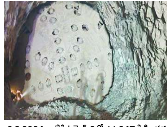
6.3.2024 నాటికి టన్నెల్-2లో 11.847 కి.మీ. వద్ద అడ్డంగా వున్న టన్నెల్ బోరింగ్ మెషిన్ తొలగించలేదు. సమస్య పరిష్కారం దిశగా ఎటువంటి చర్య తీసుకోకుండా జాతికి అంకితం చేశారు.

2019-24 మధ్య కాలంలో అధికారంలోకి వచ్చిన జగన్ రెడ్డి గాలి కొదిలేశాడు. రూ.3,500 వేల కోట్లకు పరిపాలనా అనుమతులు మంజూరు చేసి కేవలం రూ.630 కోట్లు మాత్రమే ఖర్చు చేశారు. చంద్రబాబు ప్రభుత్వం తెచ్చిన జీవో నెం.40ను జీవో నెం.50 పేరుతో రూ.1,099.40 కోట్లకు సవరించారు. వైసీపీ అధికారంలోకి వచ్చిన తర్వాత మొదటి టన్నెల్ పనులు ఒక కిలోమీటరు మాత్రమే చేసింది. రెండో సొరంగంలో నిబంధనలకు