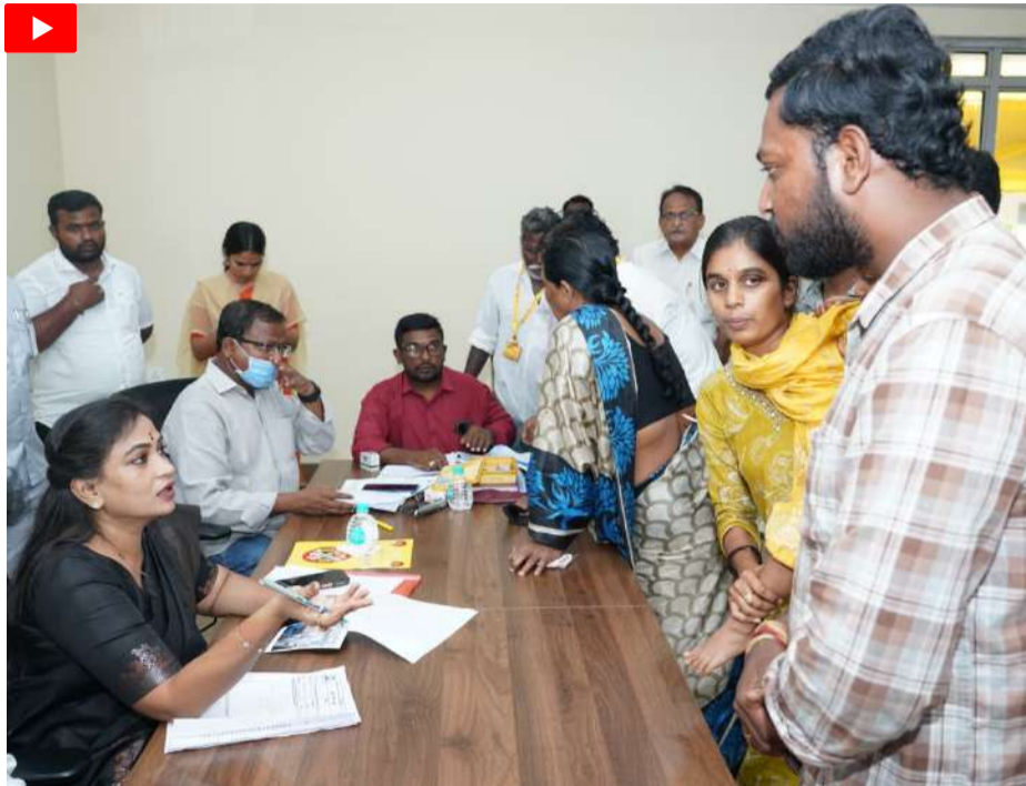
పరిష్కరించాలని నేతలు హాం శాఖ మంత్రి వంగలపూడి అనిత, టీడీపీ జాతీయ ఉపాధ్యక్షులు ఎం.డి. నజీర్ లకు అర్జీ ఇచ్చి అభ్యర్థించారు.