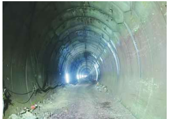
6.3.2024 నాటికి టన్నెల్-1లో వాహనాల రాకపోకలు సాగేందుకు వీలు లేకుండా 1.20 లక్షల క్యూ.మీ. మట్టి పేరుకుపోయిన దృశ్యం

2024 ఎన్నికలు దగ్గరపడుతున్న వేళ... తాము ఐదేళ్లలో ఏ ఒక్క సాగునీటి ప్రాజెక్టునూ పూర్తి చేయలేదనే అపవాదును తుడిచేసుకోవడానికి జగన్ రెడ్డి ఎంచుకున్న మార్గమే అసంపూర్తి వెలిగొండ ప్రారంభోత్సవ నాటకం. లోకంలో ఎక్కడైనా ఒక సాగునీటి ప్రాజెక్టును ప్రారంభించాలంటే రిజర్వాయర్ నుంచి కాలువల ద్వారా నీటిని వదిలి