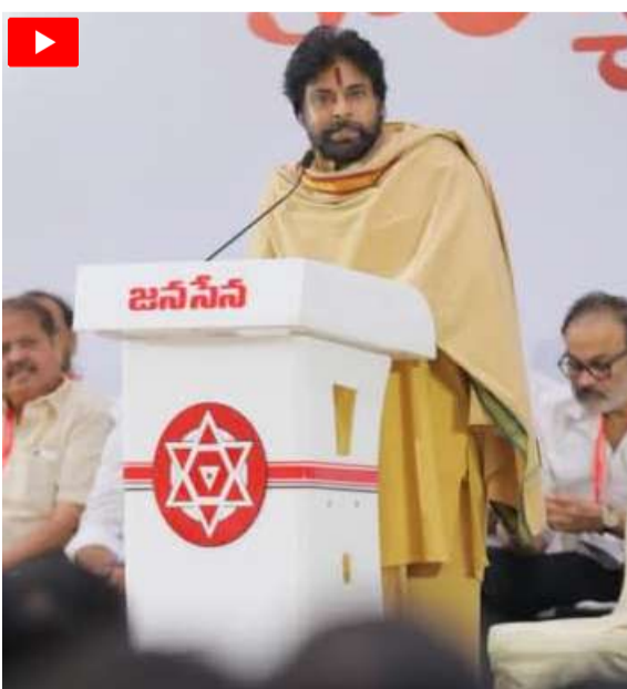
దృష్టి సారించినట్లు చెప్పారు. నేడు గ్రామాలలో, నగరాలలో రోడ్లు వేసింది ఎవరు అని ప్రశ్నించారు.

సంక్షేమ పథకాలకు వ్యతిరేకంగా కాదని.. కానీ అర్జులైన వారికి పూర్తిగా అందాలనేది తమ విధానమని స్పష్టం చేశారు. గతంలో ప్రభుత్వ ఆసుపత్రుల అభివృద్ధిని ఎవరూ పట్టించుకో లేదని.. ఇప్పుడు ఎన్నో ప్రభుత్వంలో ప్రభుత్వ ఆసుపత్రులపై